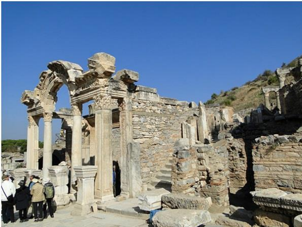
Стариот град Ефес

Според кажувањата куќата ја открила германската калуѓерка Ана Катерина Емерич, која својот живот го посветила на Бога, била парализирана и воспоставила духовна комуникација со света Богородица. Нејзе во бесвесна состојба и' се прикажувало, се вели во документите, дека Богородица е закопана во близина на Црквата. Тоа го потврдиле некои лазаријански свештеници кои во 1891 година го откриле местото на куќата во која света Богородица ги поминала последните денови од животот. Така, било откриено дека зградата во форма на крст и кубето биле руинирани, но подоцна биле реставрирани.