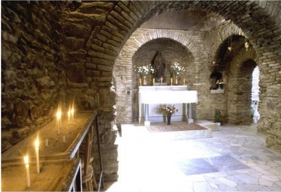
Куката на Мајка Богородица во Ефес

Таму бевме информирани дека во последните години, пред десетици илјади посетители во Театарот своите уметнички вредности ги презентирале Лучијано Павароти, Хулио Иглесиас и многу други познати светски уметници.