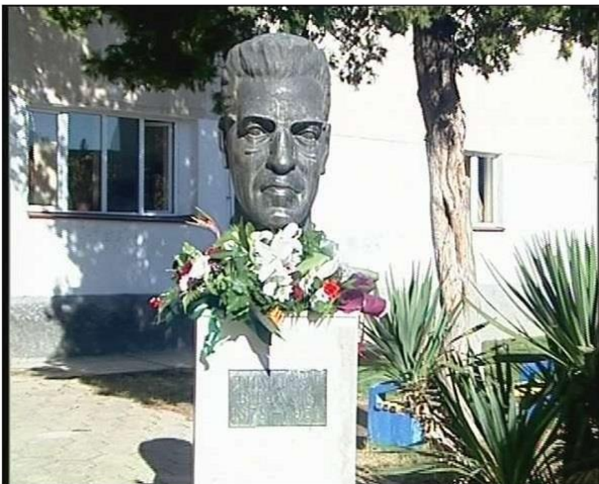
Биста на Димитар Влахов

Има голем број љубанци кои заради своите постигнувања на национално и општествено поле, потоа во политиката, образованието, науката, дипломатијата, културата, публицистиката, спортот и други гранки имаат пошироки општествени и други заслуги.