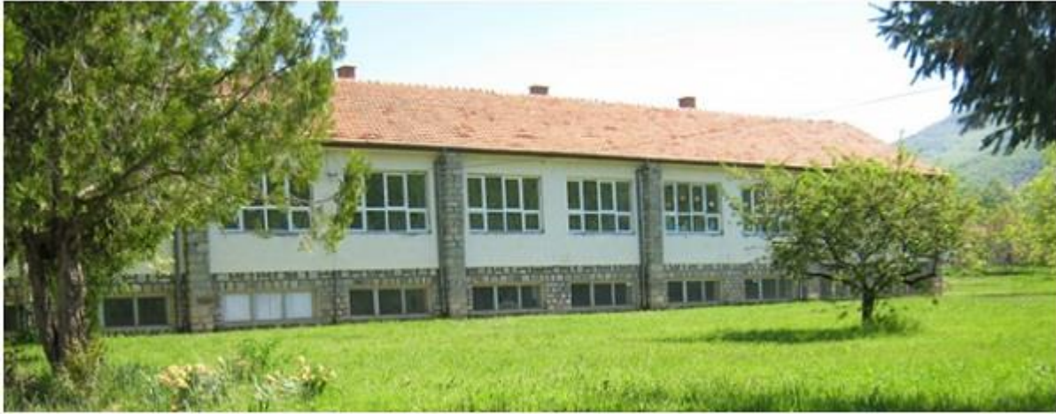
Новото училиштето „Димитар Влахов“

Во учебната 1945/46 година, кога училиштето во Љубојно го доби името на македонскиот публицист и револуционер Димитар Влахов истото прерасна во петтолетка и претставувало пресвртница во образованието за Долна Преспа. Тогаш во Љубојно се отвори интернат за децата од Сливница, Крани, Штрбово, Наколец, Брајчино и Долно Дупени кои ќе го продолжат своето образование на свој мајчин македонски јазик. Во учебната 1947/48 училиштето прерасна во седмолетка, кога и излезе првата генерација полуматуранти. Таа година се отвориле и аналфabetски курсеви за описменување на возрастното население.