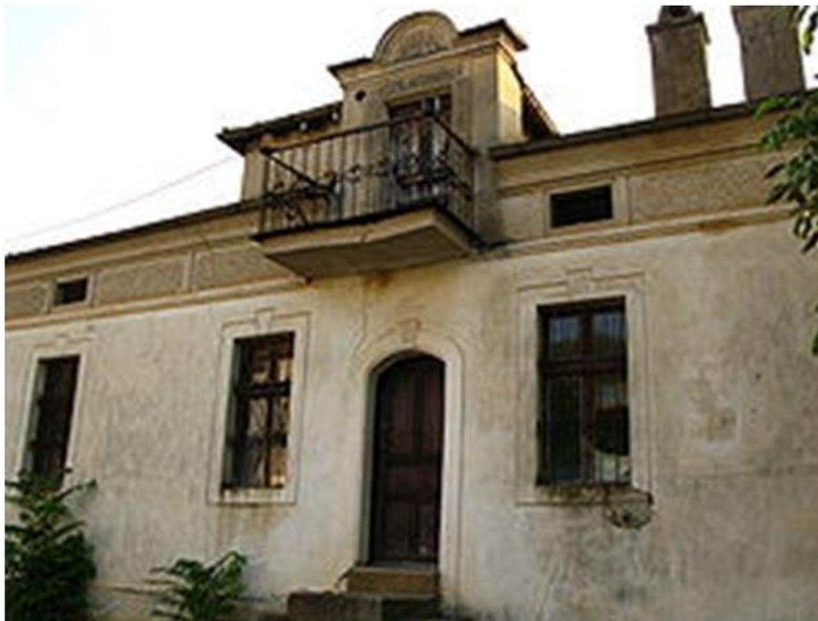
Старата зграда на училиштето „Димитар Влахов“