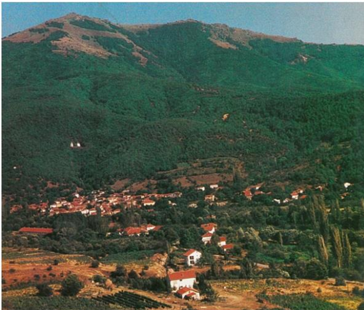
Панорама на Љубојно