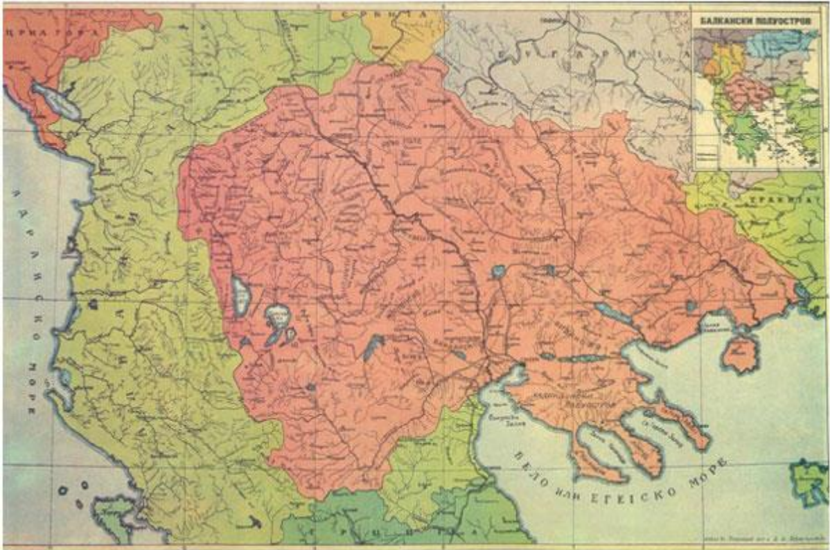
Карта на Македонија од 1913 година Продолжува

развиената трговија, заедно со различните културни, религиски и други влијанија. Македонија била еден од првите региони во кој пристигнала христијанската вера и преку неа христијанството се проширило кон запад.