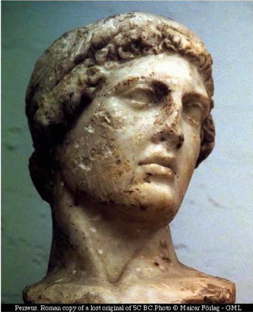
Perseus. Roman copy of a lost original of 5C BC. Македонскиот крал Персеј