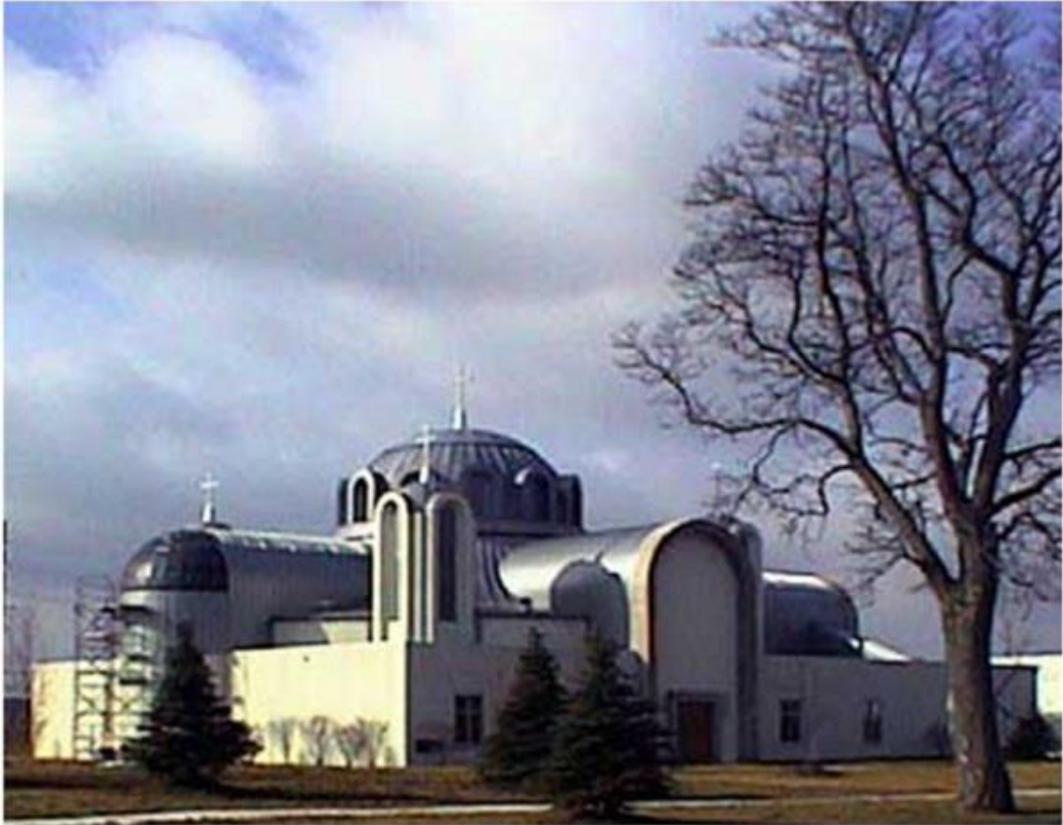
МПЦ „Св. Богородица“ во Детроит

Во Детроит ја посетивме Македонската православна црква „Света Богородица“. Таму се сретнавме со доста нашинци кои најдоа слободно време да дојдат и да слушнат за поголем број прашања и проблеми од „стариот крај“, како што често велат за Македонија. Се отвори дискусија, при што присутните посебно се интересираа за состојбите во Македонската православна црква, за состојба во Република Македонија и за животот и настаните особено во Тетовско и Преспанско.