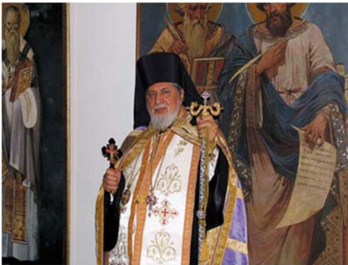
Митрополитот Кирил, надлежен за Американско-канадската епархија

Американски Држави. До храмот се изградени големи сали и други простории што претставуваат убав македонски архитектонски комплекс. Местото беше осветено на 25 септември 1995 година, а црквата беше осветена на 21 септември 2002 година од поглаварот на МПЦ архиепископот г.г.Срефан и митрополитот Кирил..