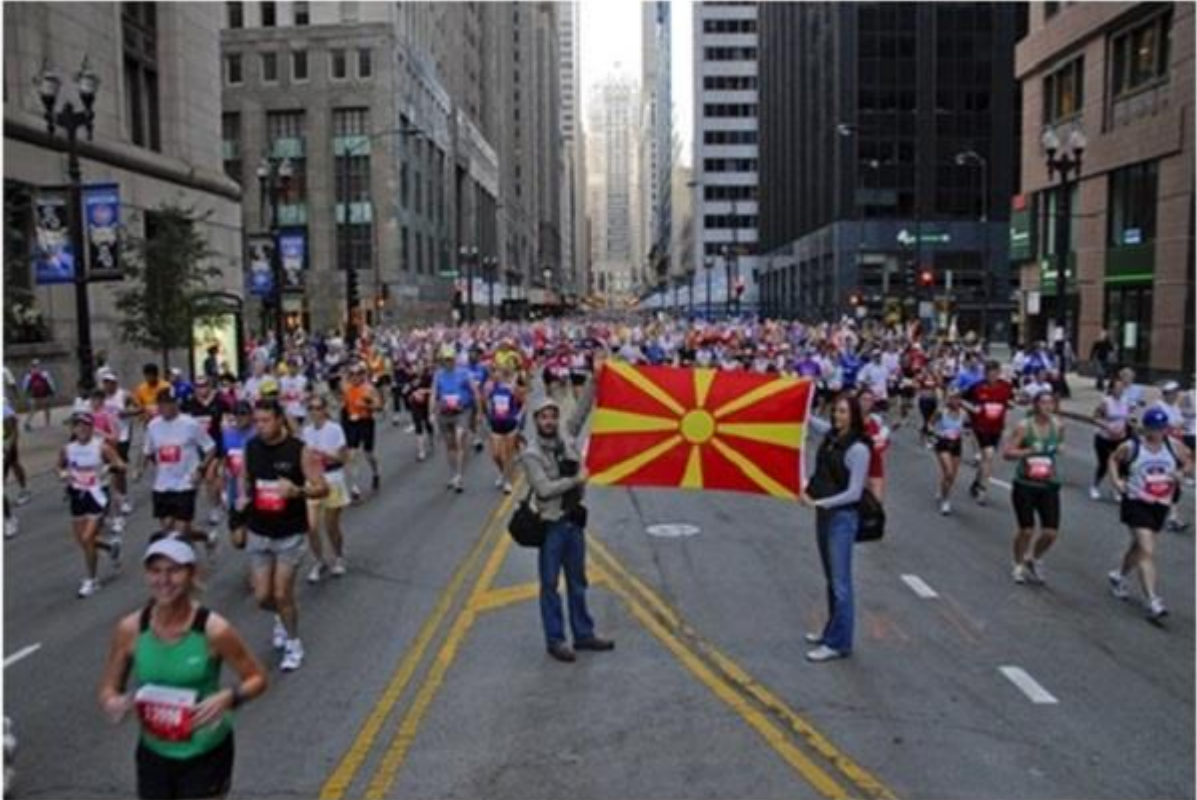
Македонците во Чикаго

Се шетавме по сите квартави во кои живеат Кинези, Италијанци, Елини (Грци), Полјаци... Според составот на населението така се нарекуваат и кварталите. Меѓутоа, центарот се чини е најпривлечен и со многу топлина. Затоа често се вели дека и Ал Капоне, не случајно го одбрал центарот на Чикаго. Домаќините ни ги покажаа и улиците од времето на Ал Капоне и од филмовите за него. Беше интересно кога слушнавме дека и еден Македонец бил дел од гангстерскиот живот во тие години.