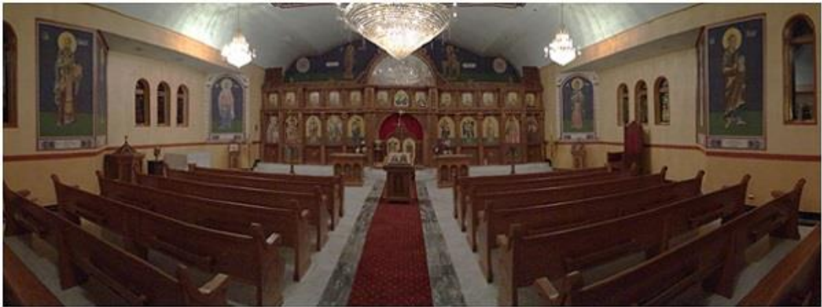
МПЦ „Св. Кирил и Методиј“ во Чикаго

неколку стотици Македонци. Стари и млади облечени во народни носии, со цвеќиња во рацете го исчекуваа тој миг, од значење за нив и за црковната општина. Секако, и за нас убавиот духовен празничен повод и свечената пригода претставуваа задоволство.