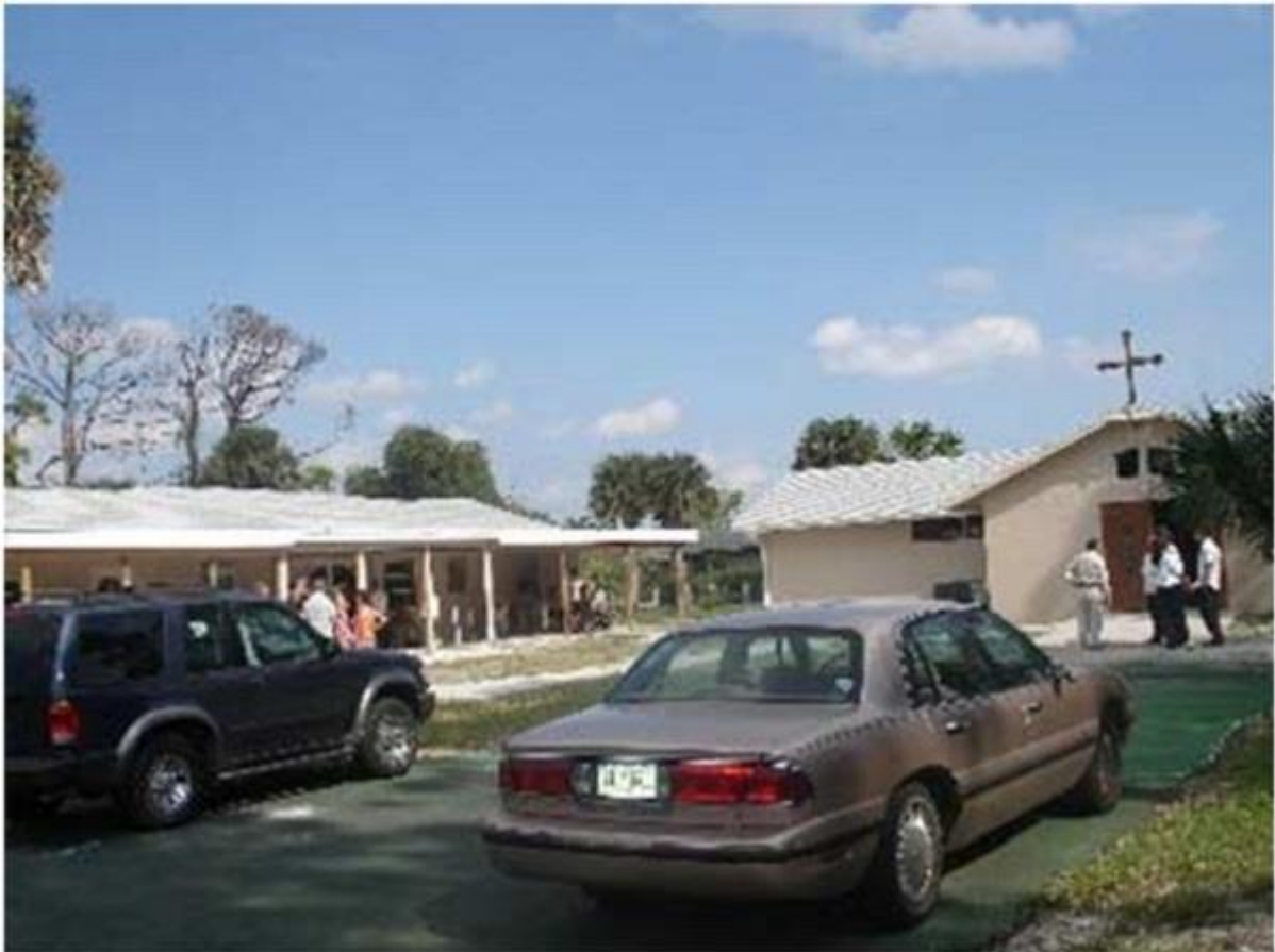
МПЦ „Св. Димитрија“ во Јужна Флорида

Во текот на престојот на Флорида ја посетивме Македонската православна црква „Свети Јован Крстител“ во Тарпон Спрингс, недалеку од градот Темпа. Таму, на западната страна на Флорида, спроти Мексико, пред голем број Македонци, кои претежно живеат во северните делоти САД и од Канада, ја промовиравме монографијата на бизнисменот Ѓорѓија-Џорџ Атанасовски.