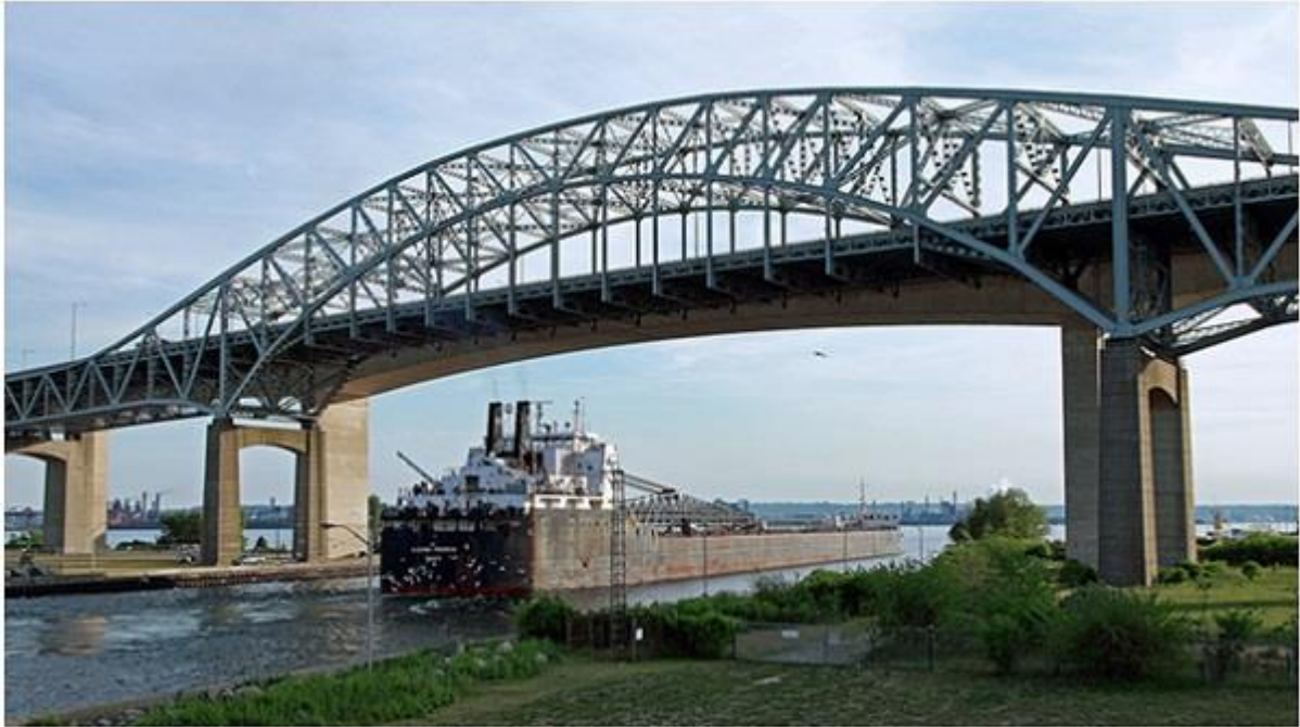
Мостот кај Хамилтон

Интересни беа податоците од кои се запознавме дека Нијагарските Водопади постепено „ползат“ кон езерото Ири, каде и започнува стрмниот дел. Пресметано е дека секоја година малиот водопад се повлекува за 5 - 6 сантиметри, а големиот за 60 - 70 сантиметри. Од создавањето па до денес „Потковицата“ се приближила до езерото Ири за 11 километри. Тоа се објаснува со разурнувањето што го предизвикува водата и материјалот што го носи врз скалестиот праг. За сегашниот изглед биле потребни 6 000 години, а за да стигне до езерото Ири и да исчезнат водопадите или да бидат уште поголеми потребни му се уште не помалку од 180 000 години.