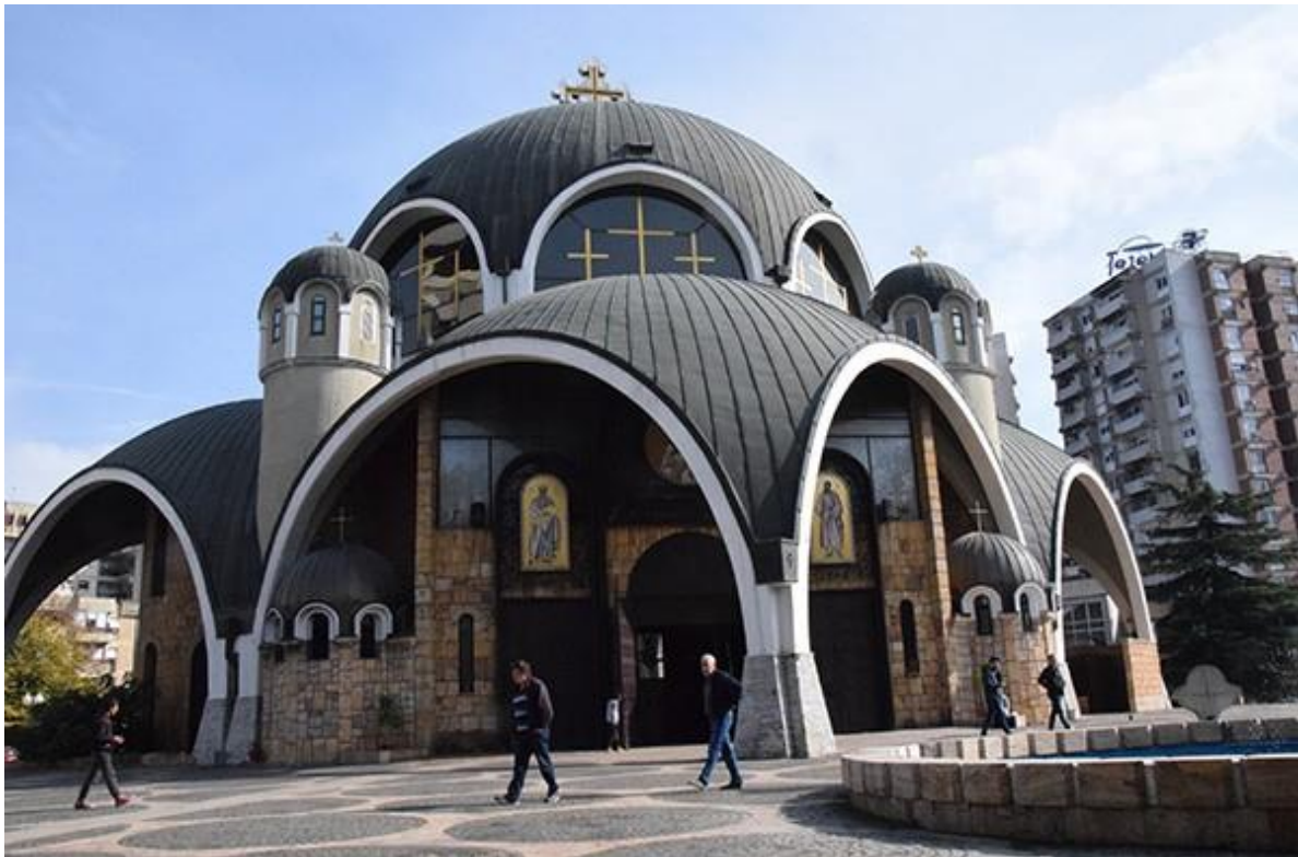
Црквата „Св. Климент Охридски“ во Скопје

Негова иницијатива, дека неможе МПЦ да бара автокефалност доколку нема своја високообразовна институција во која, идните кадри на Црквата ќе добиваат квалитетна академска наобразба беше подржана од неговото блаженство г.г. Доситеј и Светиот архијерејски синод на Македонската православна црква. Така, кон крајот на декември 1977 година, по десетгодишно аптокефално дејствување на Македонската православна црква (1967 – 1977) или по дваесетгодишно возобновено живеење на Охридската Аехиепископија во лицето на МПЦ (1958 – 1977) беше формиран Богословскиот факултет, со седиште во манастирот "Св. Јован Крстител" во Капиштец, во Скопје.