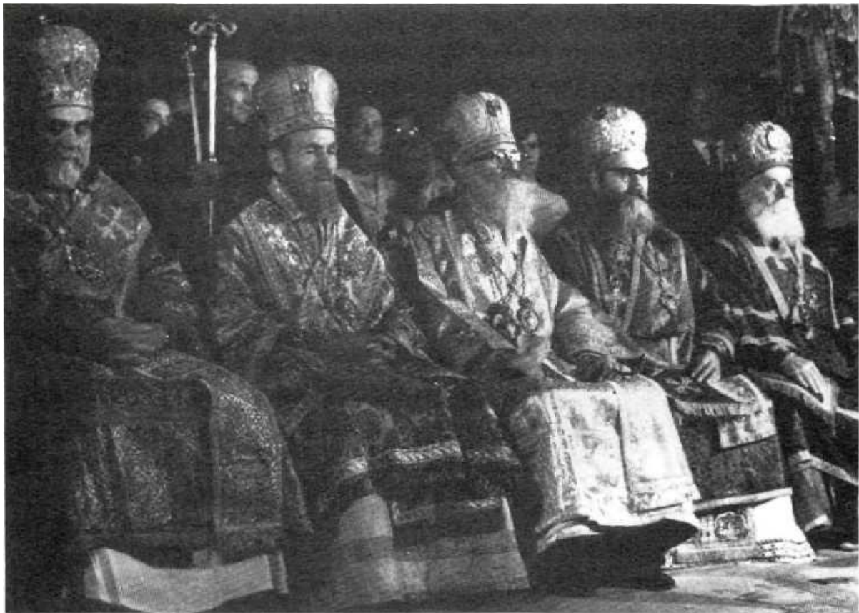
Првите владици на МПЦ