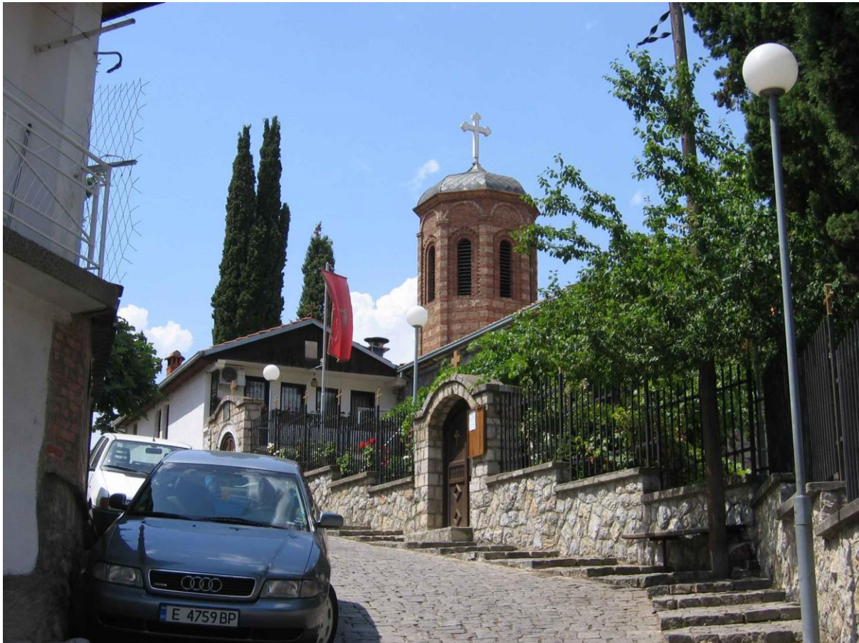
„Св. Богородица- Каменска“ во Охрид – вечниот дом на митрополитот Методиј

Во спомен на првиот митрополит на Дебарско – кичевската епархија, Македонската православна црква одбележа 40 години од смртта на првиот митрополит г. Методиј надлежен на Епархијата по возобнувањето на Охрдската архиепископија во ликот на Македонската православна црква. Во таа пригода архиепископот Стефан, заедно со домаќинот митрополитот Тимотеј и повардарскиот митрополит Агатангел, во црквата „Успение на Пресвета Богородица“ – Каменско на 28 февруари 2016 отслужија света архиерејска Литургија.