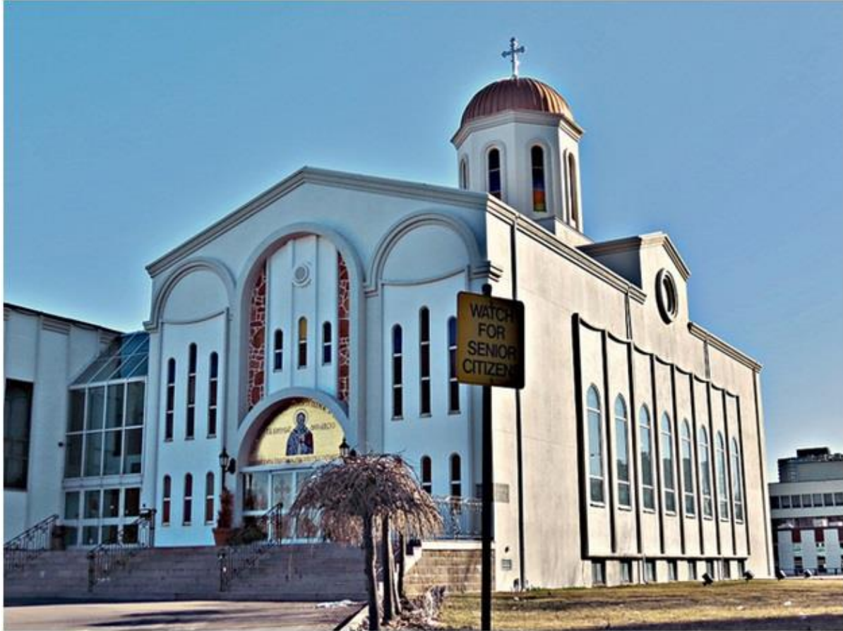
Св.Климент Охридски во Торонто

На 10 август 1969 година во катедралниот храм “Свети Климент Охридски Чудотворец” во Торонто, со величествени свечености, ќе биде извршено неговото востоличување во епископскиот Светиклиментов трон на Американско-канадско-австралиската македонска православна епархија. Чиноначалствуваше Неговото високопреосвештенство, митрополитот дебарско-кичевски г. Методиј.