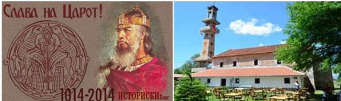
Цар Самоил / Св. Никола во Царев Двор