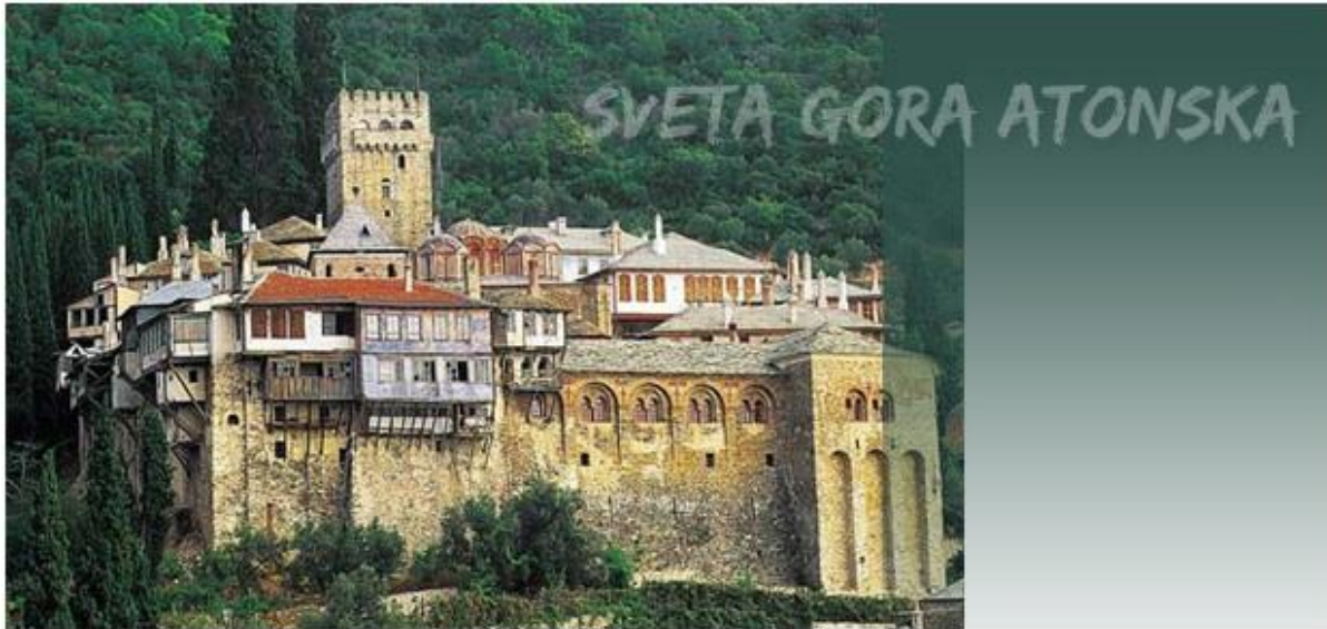
Манастир во Света Гора