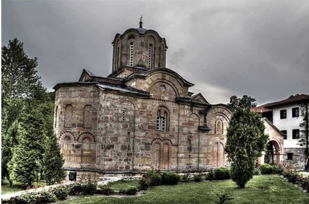
Марков манастир, Скопско

Кон крајот на XVIII век и почетокот на XIX век, во Македонија во голема мера се развивале трговијата и занаетчиството, а како резултат на тоа се создале првите граѓански социјални групи. Голем број македонски трговци одеа во западноевропските земји да тргуваат, при што доаѓале во допир со прогресивните идеи, со европската култура и цивилизацијата, како и со литературните достигнувања. При враќањето во Македонија, тие „талкачи по светот“ станувале носители на сите прогресивни идеи. Како резултат на тоа, кај нив се будела македонската национална свест и тие станувале организатори на просветната борба и активности, трудејќи се да отворат народни училиште и цркви.