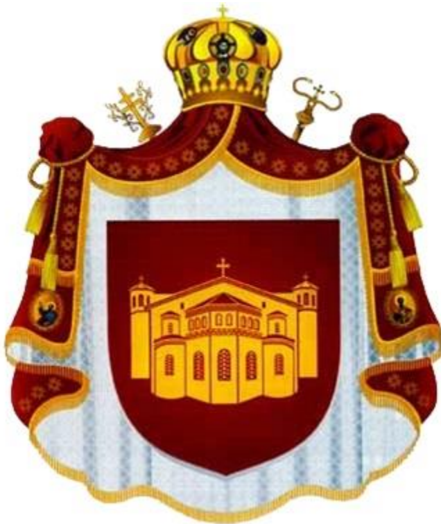
Грбот на МПЦ-ОА

Во книгата се објавени имињата на над 150 познати и признати иселеници, со различни образованија и занимања, општественици и духовници вградени во изградбата на Македонската православна црква од нејзиното конституирање до денес, како и дваесеттина текстови за иселеништвото и МПЦ-ОА. Застапени се академици, научници, писатели, новинари, публицисти, донатори, хуманисти, патриоти, носталгичари и вљубеници во Македонија. Нивниот број би можел да биде многу поголем. Тоа во случајот не е толку битно, туку битно е што овој импозантен број имиња, значајни за нашата национална, духовна, културна, стопанска и научна дејност, го прикажува македонското иселеништвото во минатото и сегашноста.