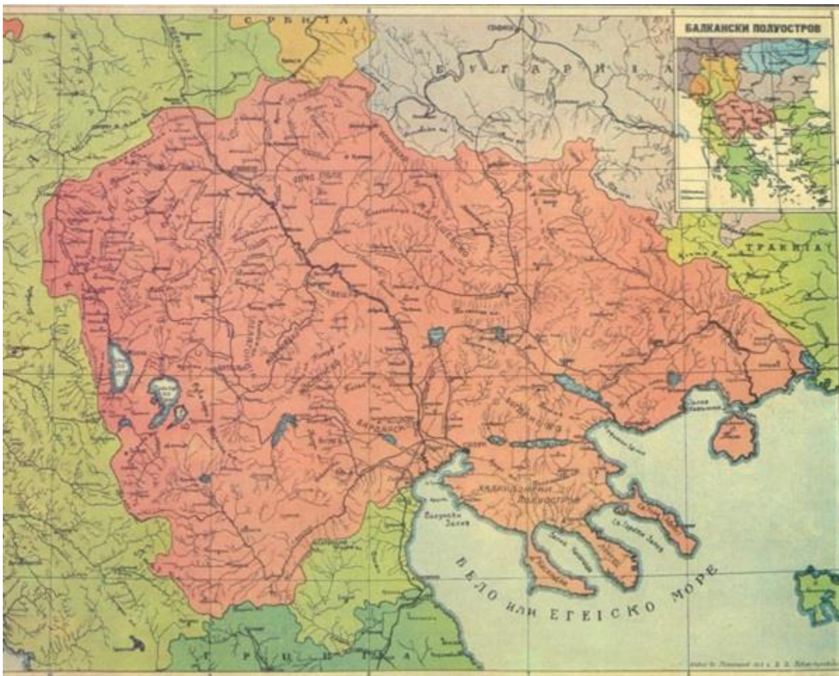
Македонија пред поделбата (распарчувањето) во 1913 година

Со прелистување на страниците на ова дело читателот, макар површно ќе се запознае со нив и нивните дела, со придонесот што го имаат во македонското иселеништво, а особено нивниот придонес што го имаат за Македонската православна црква, Охридската архиепископија, како и на други аспекти врзани со македонскиот народ и на етничка Македонија.