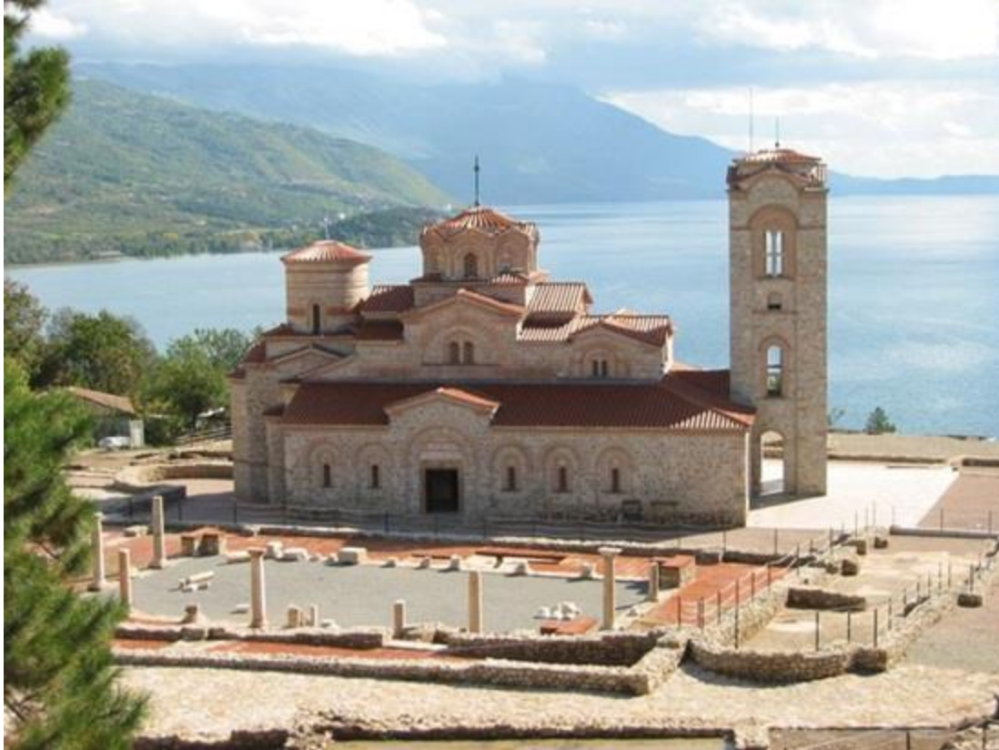
Црквата „Свети Климент и Свети Пантелејмон“ на Плаошник-Охрид

За чудотворната моќ на свети Наум среќаваме и во житијата за него, што, без сомнение, биле извор и на народните умотворби, сепак, култот на свети Наум најмногу е одразен во преданијата раскажувани на овој простор од најстари времиња, значи уште од времето кога светителот бил жив. Сепак, тие се бележени од средината на XIX век па сè до денес. Најрано се среќаваат во зборниците на браќата Миладиновци и Кузман Шапкарев, а подоцна и кај други собирачи на македонски народни умотворби, патописци, или, едноставно, кај луѓе што престојувале или пишувале за Охрид и Охридско и посебно за манастирот кој со својата местоположба и со култот на светителот го привлекувал вниманието.