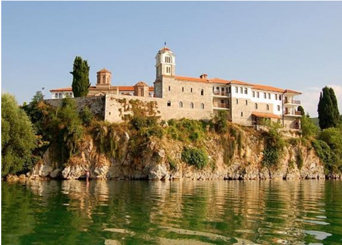
Манастирот „Свети Наум Охридски“ на Охридското Езеро

словенски учител и исто е познат по градот Охрид. Свети Климент бил и првиот словенски епископ со титула Епископ Велички.