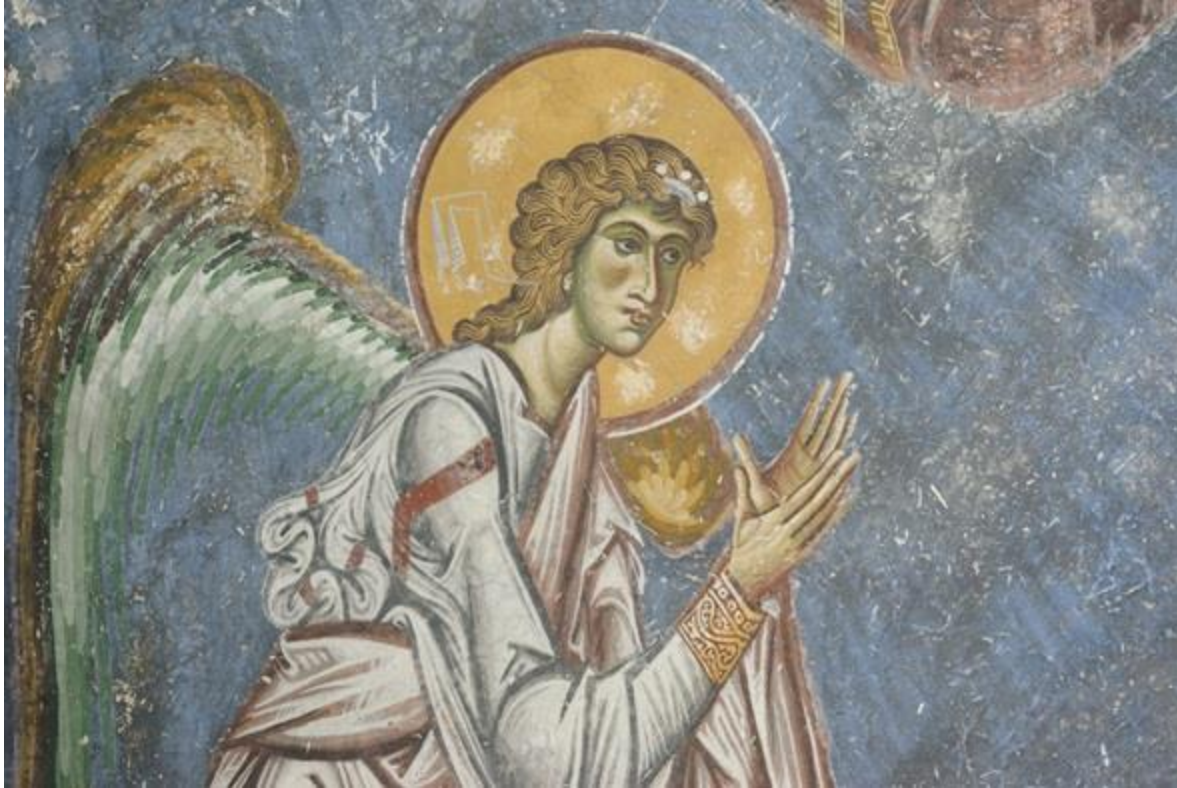
Ангелот од црквата „Свети Ѓорѓи“ од Курбиново, Преспа

Се претпоставува дека свети Климент е роден околу 830/840 година. Починал на 27 јули според стариот, односно на 8 август според новиот календар во Охрид. Бил погребан во гробот што самиот си го подготвил во црквата „Свети Пантелејмон“. Уште за време на животот, свети Климент својот именден го празнувал на денот кога Светата христијанска црква го празнувала споменот на светиот свештеномаченик Климент папа Римски, односно на 25 ноември според стариот или на 8 декември според новиот календар. Поради тоа, подоцна, Светата црква главниот празник поврзан со неговото име го поместила на денот на неговиот именден, а на денот на неговото упокоение (27 јули/8 август) се празнува споменот на светите седмочисленици (светите Кирил и Методиј, Климент, Наум, Ангелариј, Сава и Горазд), како и споменот на светиот великомаченик Пантелејмон.