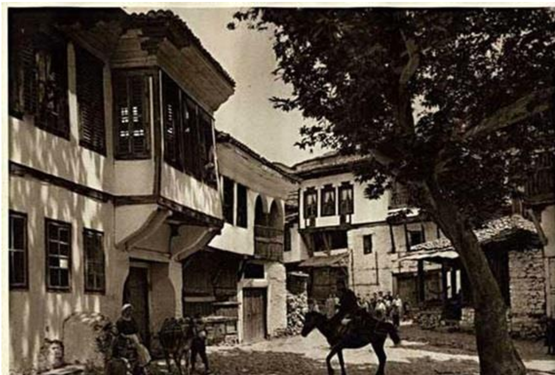
Ново Село, Штипско

Господин господин Михаил е роден во Ново Село, Штипско, на 20 мај 1912 година, како Методи Гогов од родители Панче и Санда. Тој е едно од најсветлите и најзнаменитите имиња на древното и легендарно Ново Село, на македонскиот црковен и духовен дом. Сиот свој живот архиепископот Михаил и' го посвети на црквата, на религијата, на духовното зајакнување, обединување и возвишување на својот народ и својата татковина – Македонија. Љубовта и блискоста со Бога почнува од родното Ново Село во црквата „Света Богородица“. Малиот Методи Гогов бил слаб и со крвко здравје, па по желба на неговата мајка Санда, шестгодишното дете редовно ќе ги посетува богослужбите и ќе се грижи за чистотата на црквата.