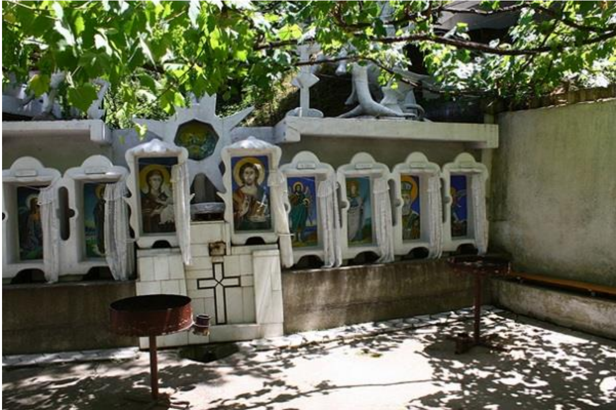
„Света Недела и Света Петка“ во Велес