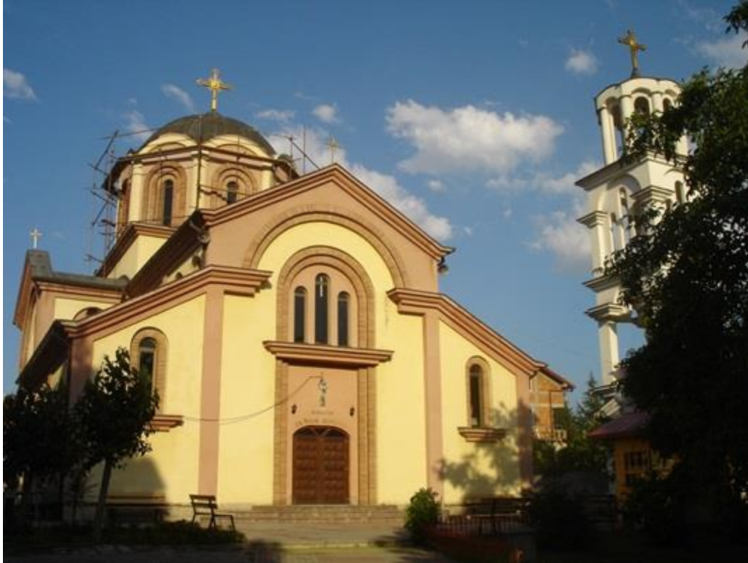
“Свети Наум Охридски“ во Радишани