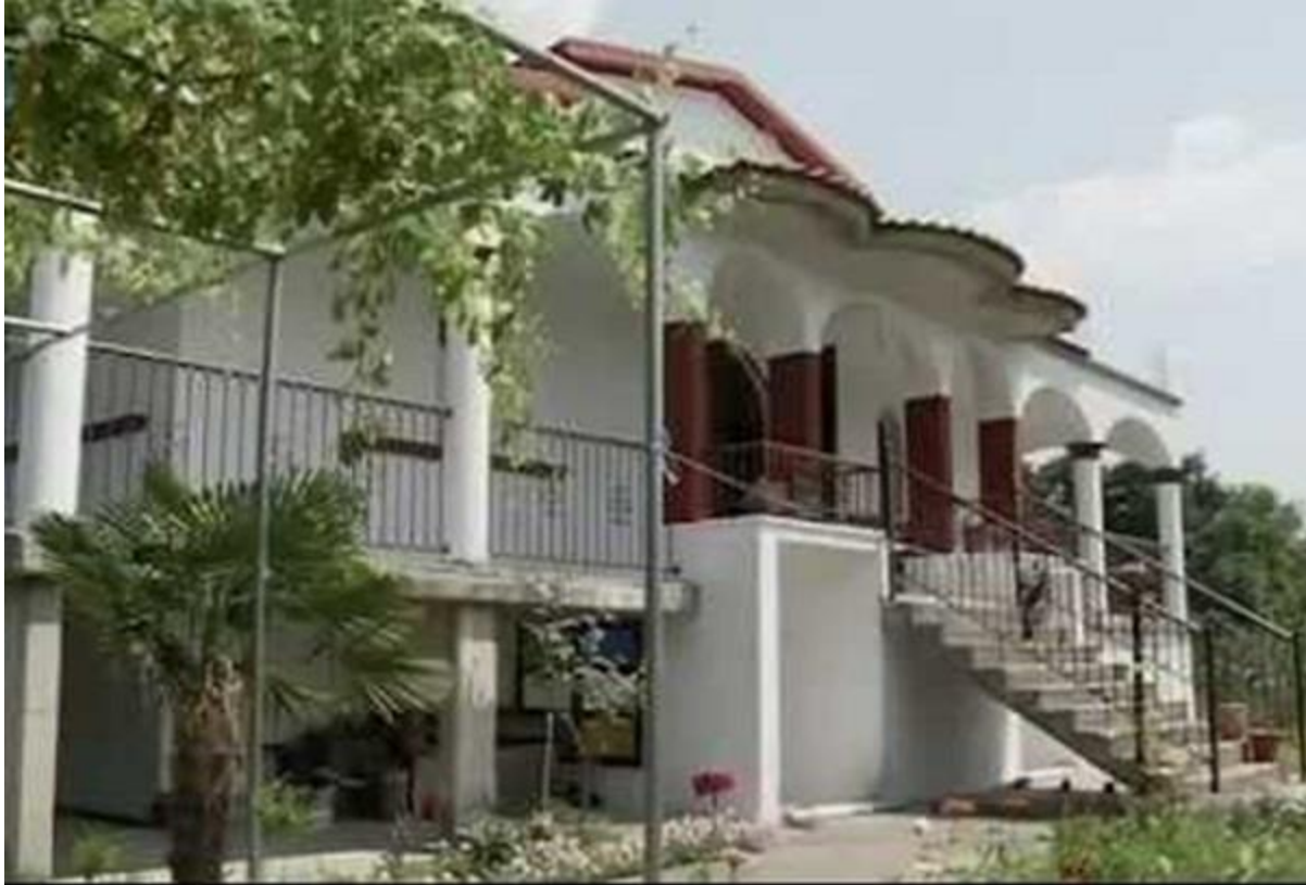
Црквата „Света Злата Мегленска,, во Сobotско