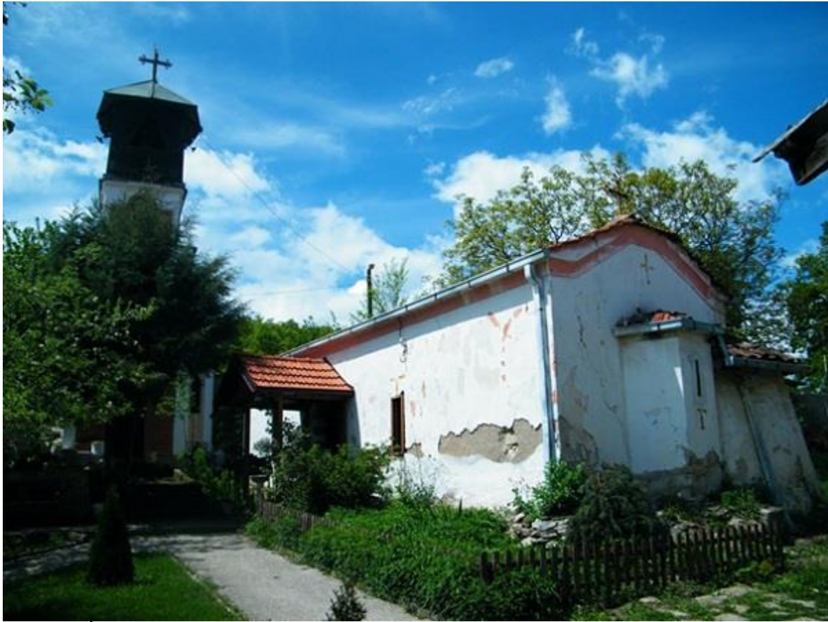
„Свети Горѓи“ Кучково, Скопско

се'уште се зголемува. Црквата станува симбол на отпор на македонското малцинство во Грција, кое учи да ги почитува своите корени, но истовремено станува и мета на напади на грчките националисти.