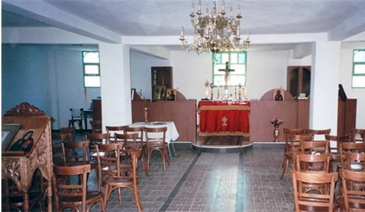
Внатрешниот дел на црквата „Света Злата Мегленска“

Меѓутоа, населението не наредува на играта на грчката полиција и фотографиите ги носи на Солунскиот универзитет, каде на посебна работилница се докажува дека се тие добра фотомонтажа. „И слеп човек би видел дека фотографијата е лажна,“ ќе изјави на работилницата еден од присутните универзитетски професори.