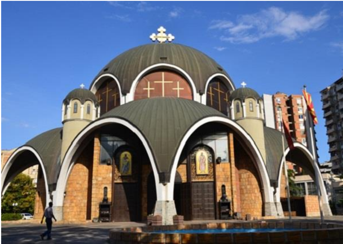
Соборниот храм „Свети Климент Охридски“ во Скопје

Инаку, архиепископот господин господин Стефан беше замонашен на 3 јули 1986 година во манастирот „Свети Наум Охридски-Чудотворец“ во Охрид, а хиротонисан за епископ на 12 јули 1986 година во храмот „Свети Димитриј“ во Скопје како митрополит злетовско-струмички, а кратко потоа бил именуван за митрополит на Брегалничката епархија.