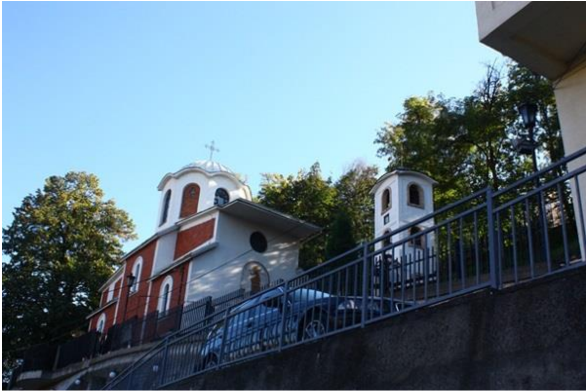
„Свети Јован“ Скопје

Карактеристично за ова село е тоа што во неговата околина се наоѓаат археолошките локалитети: Ерековски Ливади - населба од римско време; Плочи - населба од римско време и Селиште - некропола од средниот век. Селото Добрушево отсекогаш било едно од подобрите села, па и денес не го изгуби тој примат, туку напротив. Во него живеат повеќе од 600 жители и е единствено село што има и сопствен парк. Инфраструктурно селото е поврзано и со Прилеп и со Битола, со асфалтни патишта.