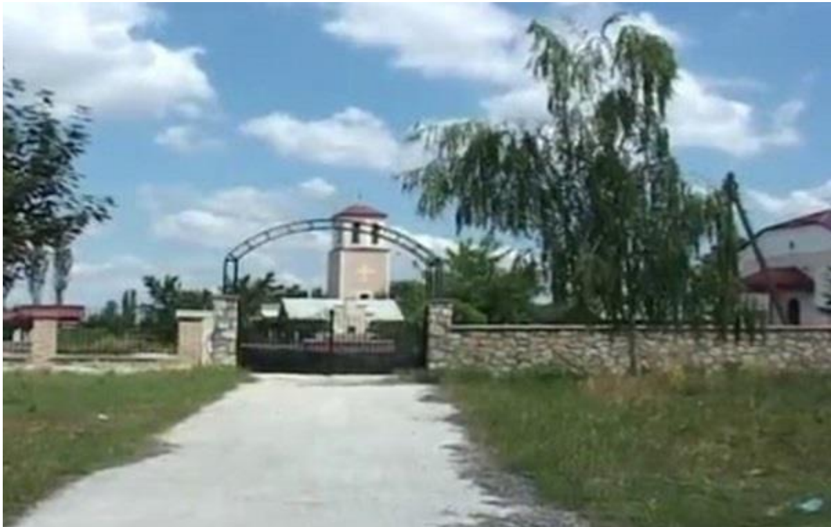
Црквата „Христово Вознесение“ во Добрушево

На 12 ноември 2009 година, Македонската православна црква во своето име ја вклопи додавката Охридска архиепископија, како директна наследничка на старата Охридска архиепископија. Покрај додавање на додавка, Македонската православна црква – Охридска архиепископија изврши и промени во грбот и знамето, односно наместо приказот на црквата „Света Богородица–Перивлепта“, сега е црквата „Света Софија“ од Охрид, како седиште на архиепископите на Охридската архиепископија.