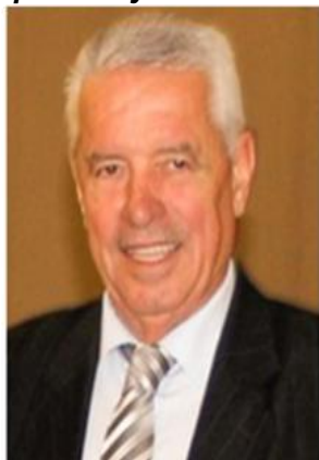
Пишува: СЛАВЕ КАТИН