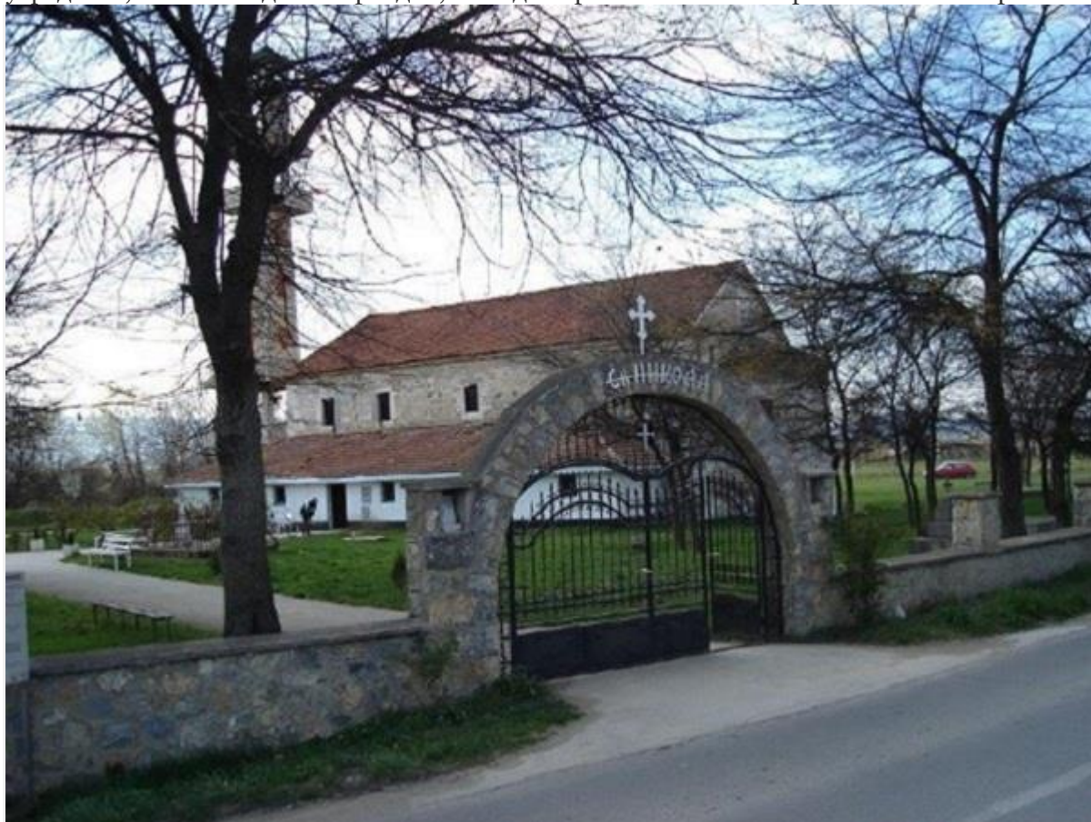
Црквата „Свети Никола“ во Царев Двор

На 5 јули 1967 година е избран за викарен епископ со титула тивериополски од страна на Светиот архијерејски синод на МПЦ-ОА и станува негов најмлад член. По унапредувањето во чин архимандрит, на 11 јули истата година, во предвечерието на празникот посветен во чест и слава на апостолите свети Петар и свети Павле, е извршено наречението во епископски чин, а утредента, на самиот ден Петровден, ќе биде хиротонисан за викарен епископ тивериополски.