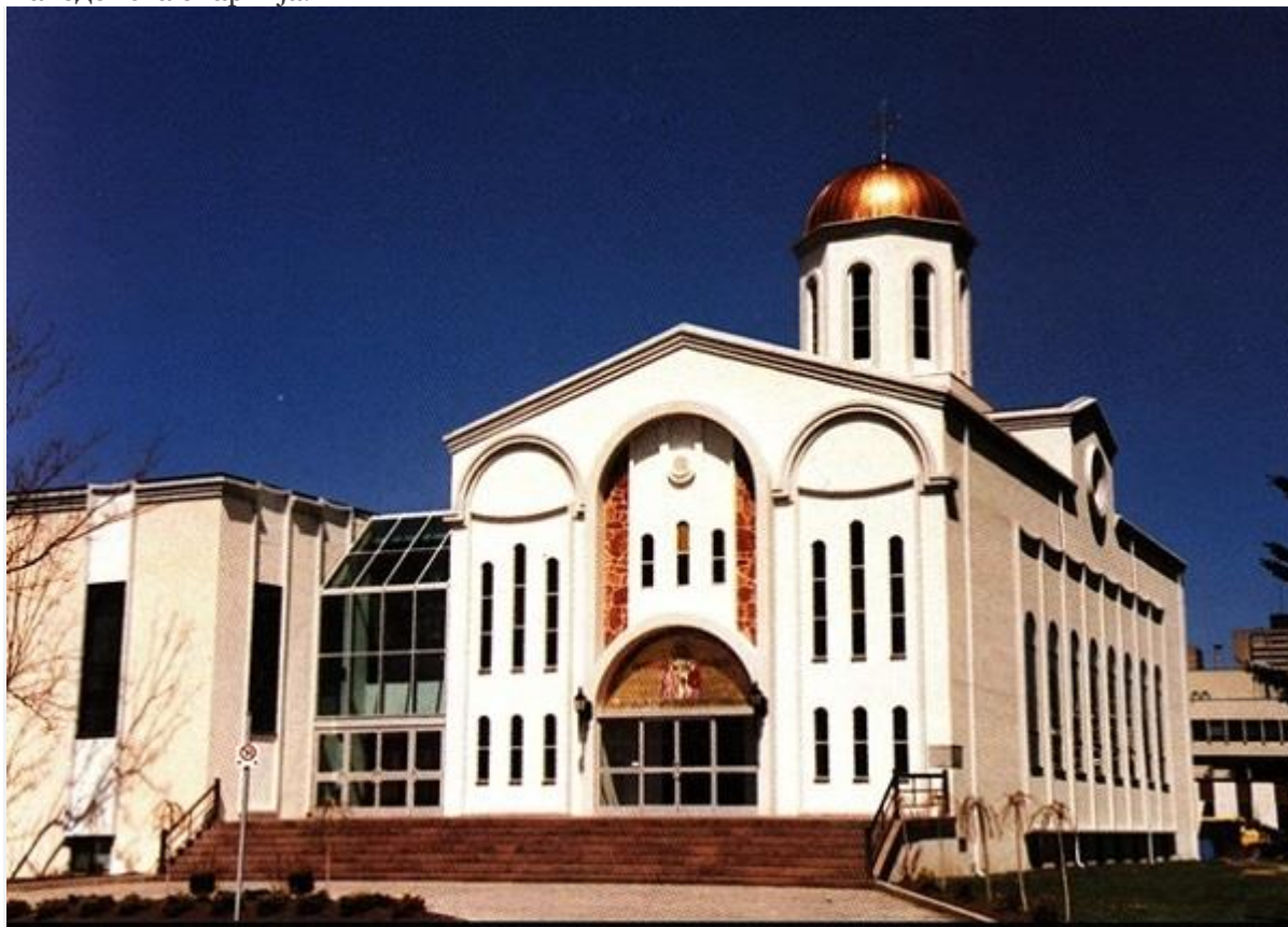
„Свети Климент Охридски“ во Торонто