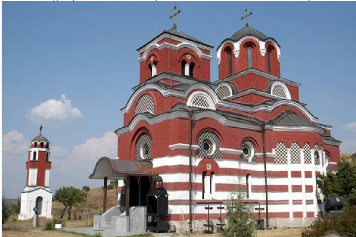
Црквата „Свети Ѓорѓија“ во Дељадровце