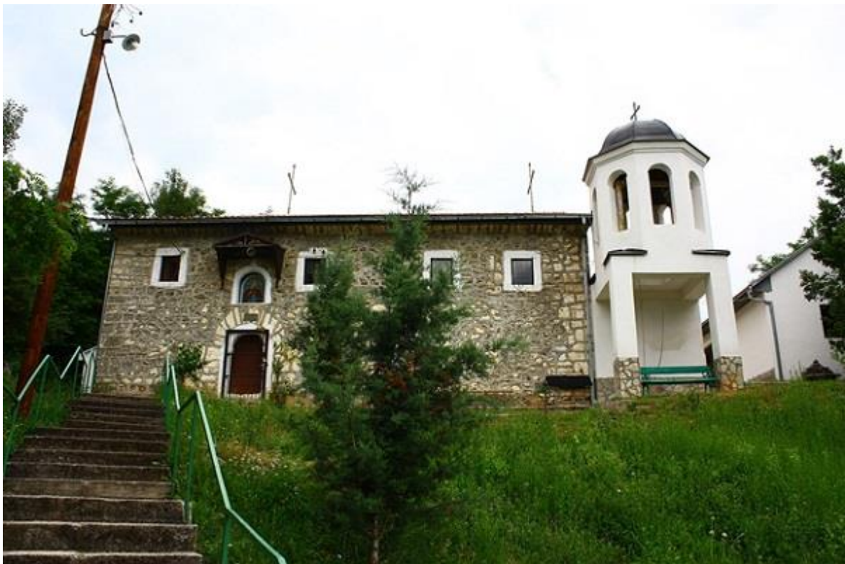
Црквата „Света Марена“ во Зубовце