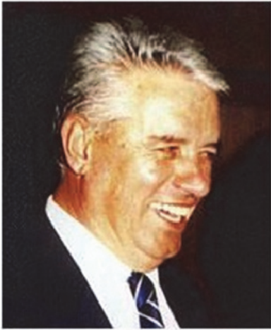
Пишува: СЛАВЕ КАТИН