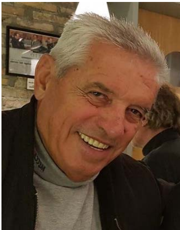
Пишува: СЛАВЕ КАТИН

Во Додатокот, пак, е даден се дадени текстови за иселувањето и иселеничката судбина на Македонците од етничка Македонија, текст на англиски јазик за судбината и вистината за Македонците во светотот, како и заклучоци на германски, француски, руски и српски јазик, со цел да се запознаат и другите читатели со содржината на делото „Македонски иселенички меридијани“.