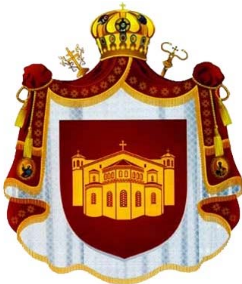
Грбот на МПЦ-ОА

христијанството како религија на Македонците насекаде во светот, за апостол Павле кој го раширил христијанството преку Македонија во Европа, меѓу кои за: солунските браќа светите Кирил и Методиј и нивното дело, за свети Климент и свети Наум Охридски, за Македонската православна црква, Охридска архиепископија.