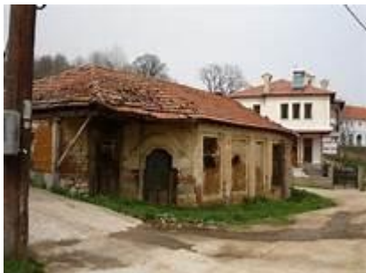
Селото Буф, Леринско

преселила во Битола, во Република Македонија. Таму Бранов го започнал своето образование и таму му се отвориле патиштата кон иднината.