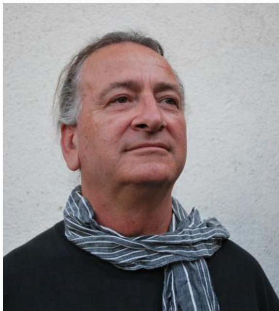
Пишува: ДУШАН РИСТЕВСКИ

Првата иницијатива за МПЦ се роди во Мелбурн, Австралија, во 1956 година. Новоизградениот храм „Свети Ѓорѓи“ во Фицрој е првата МПЦ осветена од македонски владика во 1960 година. Веќе во 1962 година е поставен камен-темелник на МПЦ „Свети Петар и Павле“ во Гери - Индијана, а во 1964 година на црквата „Свети Климент Охридски“ во Торонто. До Втората светска војна, бројот на Македонците во Австралија беше само неколку илјади. Меѓутоа, по војната овој број рапидно се зголемува, бидејќи, речиси цели села од егејскиот дел на Македонија, како и од Битолско, од Охридско, од Преспанско и од други делови на Македонија, се преселија во Австралија. И така, никнуваа македонските православни цркви во светот. Овој феномен станува посебна преокупација на Катин, кој на оваа тема дава посебно место во своите дела за дијаспората.