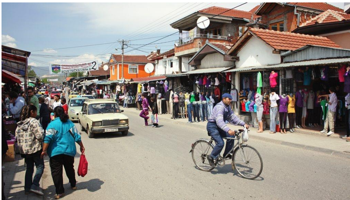
Ромите во Скопје

Инаку, генералниот секретар на Советот на Ромите во Европа, Торбјорн Јагланд, по повод Меѓународниот ден на Ромите - 8 Април, во 2014 година во едно од своите интервјуа изјавил дека Ромите придонеле многу за европската култура. Тој како пример ги навел композиторите Лист, Брамс и Верди кои биле под влијание на ромската музика и дека фламенкото е инспирирано од ромскиот танц. Јагланд додал дека популарни изведувачи и глумци, вклучувајќи ги и Чарли Чаплин и Јул Бринер тврделе дека се од ромско потекло.