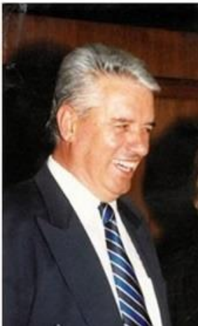
Пишува: СЛАВЕ КАТИН

Ромите во светот имаат своја химна која е омилена кај сите изведувачи на ромската песна, особено кај Есма Реџепова–Теодосиевска. Тоа е песната Ц(Г)елем, ц(г)елем. Оваа песна која често се користи како химна на ромскиот народ ја составил Жарко Јовановиќ. Насловот е адаптиран во многу земји од страна на локалните Роми, со цел да одговара на нивниот мајчин јазик и правопис и дијалектот на ромскиот јазик. За првпат била изведена на Првиот светски ромски конгрес одржан во 1971 година во Лондон. Исто така, Ромите во светот имаат и свое знаме.