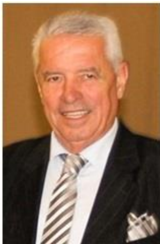
Пишува: СЛАВЕ КАТИН www.slavekatin.com