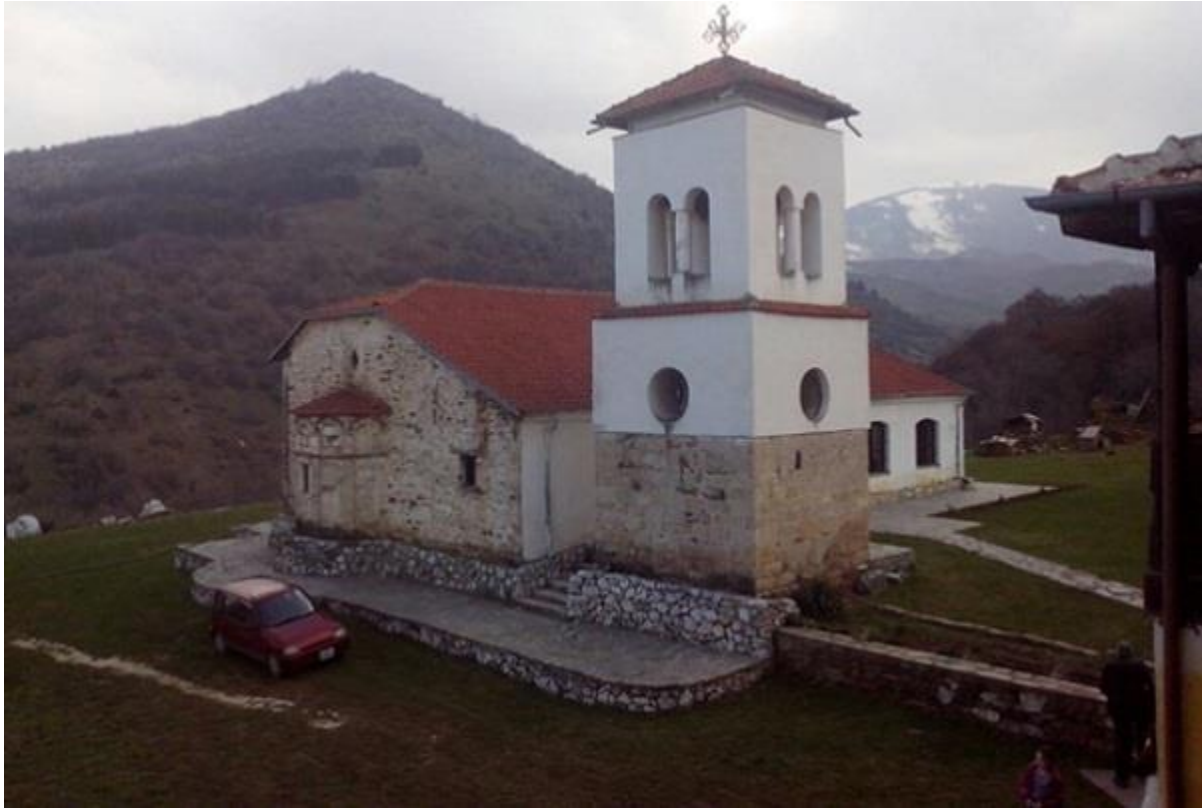
Манастирот „Свети Ѓорѓи“ во Велушина

Инаку, Велушина во минатото било напредно и богато село. Неговите земјишни имоти се простирале до источниот пат што води од Битола кон Меџитлија. Во тоа време во селото живееле околу 1.200 жители. Меѓутоа, денес за жал, се останати само дваесетина семејства, а се населуваат семејства на македонски Албанци од близното село Острец.