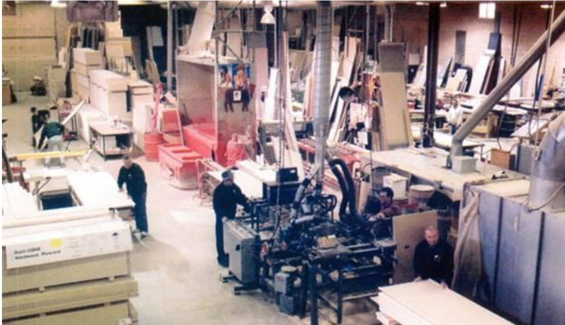
Дел од фабриката

години во неговите раце беше кормилото на фабриката, посебно на маркетингот, односно освојувањето на пазарот. И денес како пензионер е секојдневно присетен во фабриката. Тој си остана да биде разговорлив Македонец, милозлив соговорник, со питомо срце и душа, каков што беше на помлади години.