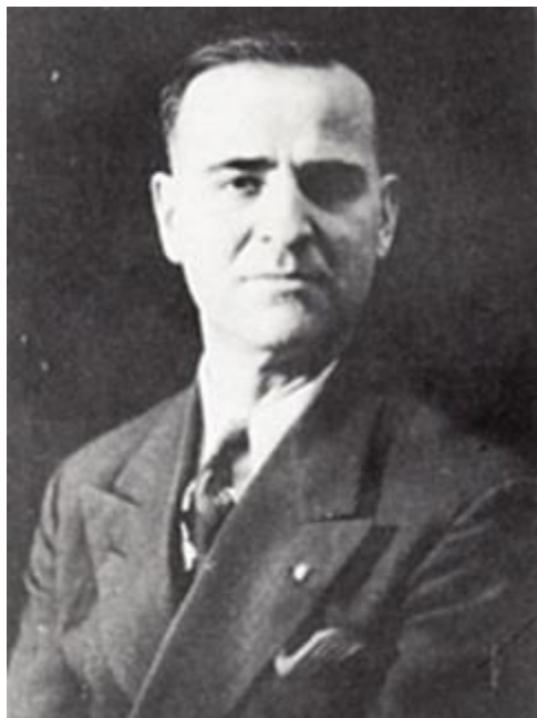
Фото Томев - ликовен уметник и публицист од Торонто (6)