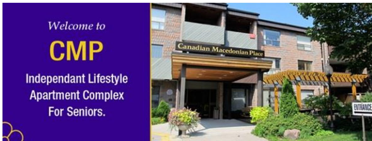
Канадско македонски центар – Старскиот дом

Фото Томев а автор и на публикацијата под наслов „Кратка историја на селото Желево, Македонија“. Книгата ја издало Добротворното братство на Желево во Торонто, во 1971 година. Таа е печатена на 170 страници (16ц23 цм), на англиски и на бугарски јазик и претставува опширна монографија за селото Желево, за постанокот, животот во турско време, илинденскиот период, за народното училиште, црквите, обичаите, традициите и за другите карактеристики на селото Желево. Книгата претставува добра основа за проучување на вистината за Егејска Македонија.