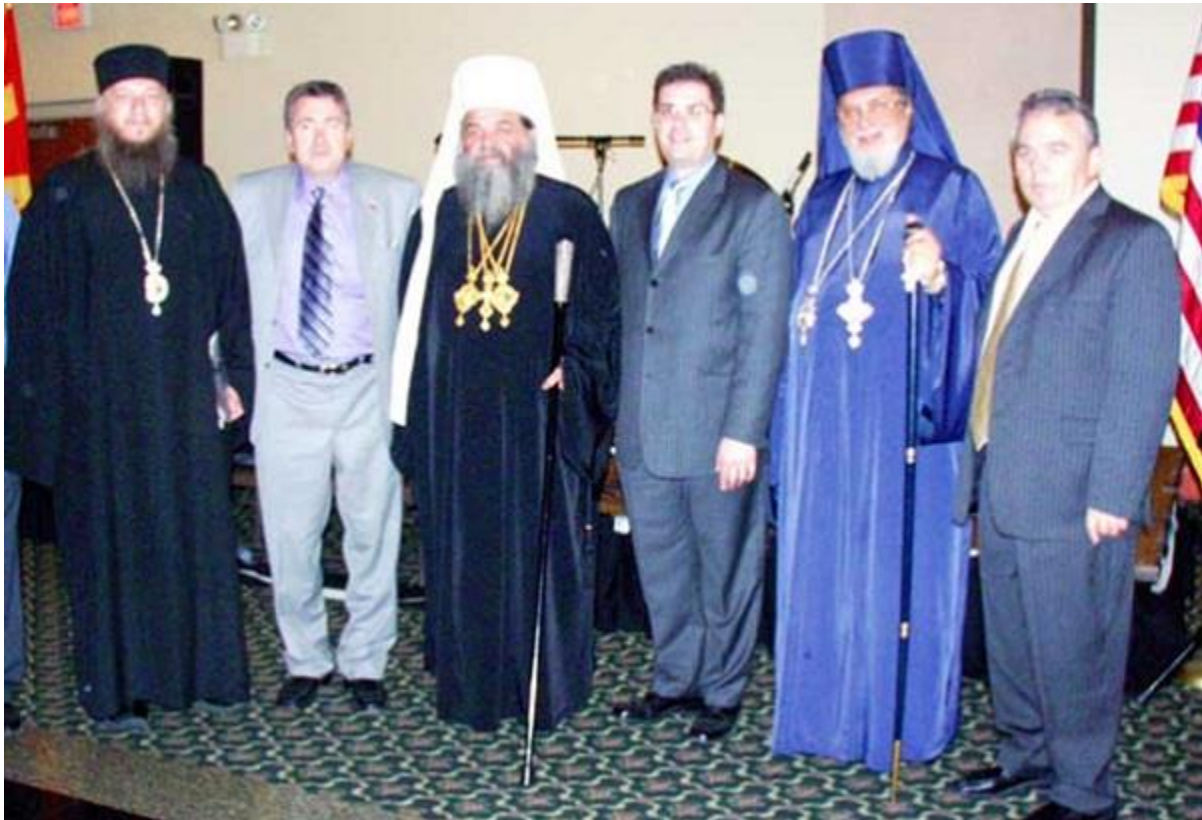
Една од посетите на македонски владици на Детроит