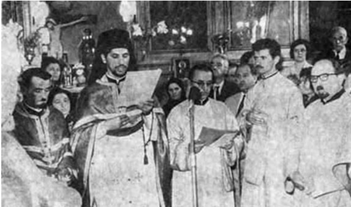
Дел од востолучувањето на митрополитот Кирил

Како член на Синодот, веднаш се вклучува во довршувањето на обемниот елаборат за обнова на автокефалноста на Охридската архиепископија. Пет дена подоцна (на 17 јули 1967 година) Светиот архиерејски синод на МПЦ одржа седница во црквата “Света Богородица Перивлепта” во Охрид, на која беше донесена историската Одлука за целосно возобновување на автокефалноста на Охридската архиепископија во лицето на Македонската православна црква. По потпишувањето од страна на сите членови на Синодот: архиепископот г.г. Доситеј и митрополитите: г. Климент, г. Наум, г. Методиј и г. Кирил, истиот ден беше презентирана Одлуката пред членовите на Третиот црковно-народен собор, што се одржа во катедралниот храм на охридските архиепископи “Света Софија”. На овој Собор господин Кирил е избран за прв надлежен архиереј на штотуку востановената Американско-канадско-австралиска македонска православна епархија, со која ќе раководи повеќе од две децении. Зема учество во повеќе делегации на МПЦ за запознавање на сестринските цркви со обновата на автокефалноста на Црквата на македонскиот народ, преку претставување на опширниот елаборат. Истовремено ја извршува и функцијата претседател на Комисијата за враќање на отуѓените македонски богослови од богословиите на СПЦ.