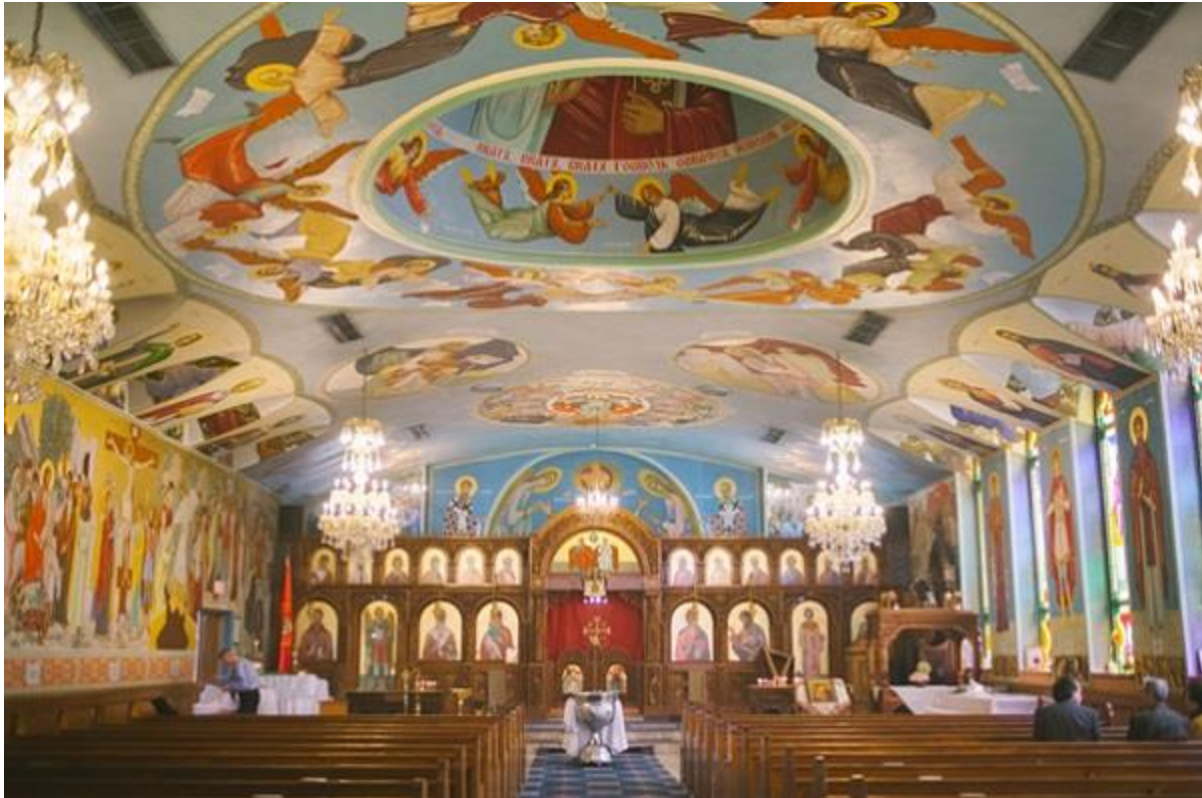
Црквата „Свети Климент Охридски“ во Торонто