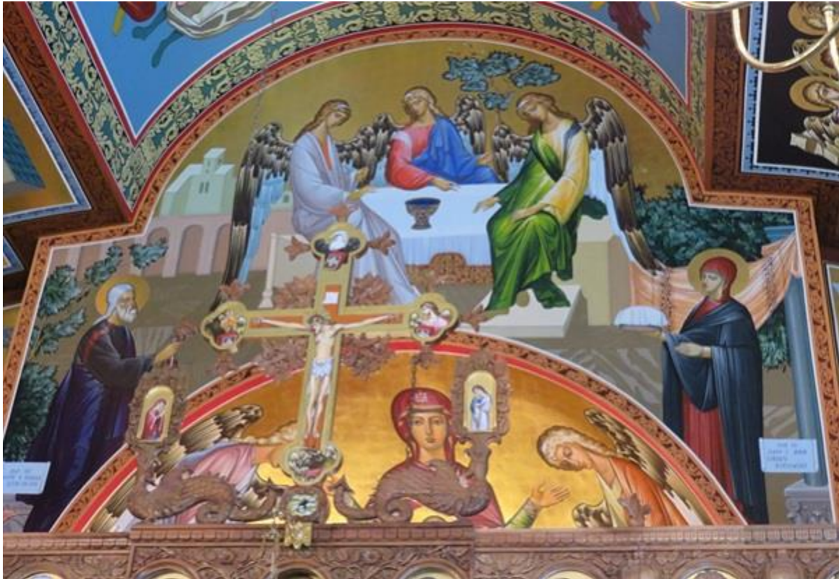
Црквата „Свети Димитрија Солунски“ во Маркам