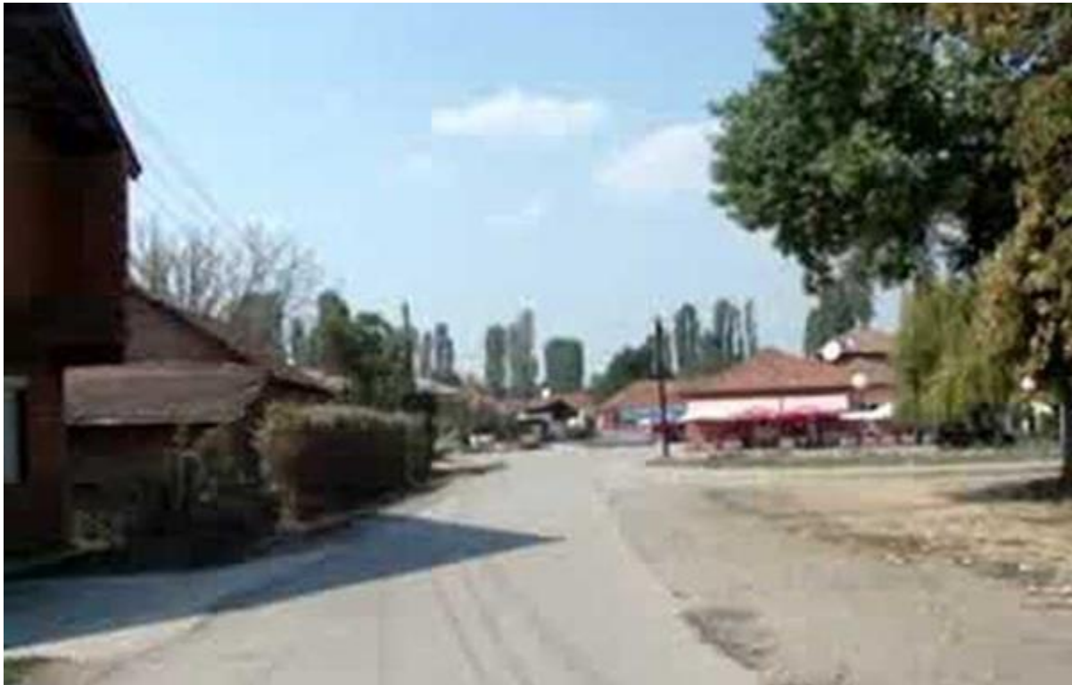
Село Волино, Охридско

Инаку, неговото родно Волино е чиста македонска населба која се наоѓа на петнаесетина километри северозападно од Охрид, од западната страна на селото Косел на патот кон Битола, а на источната страна од селото Горенци. Во селото Волино живеат околу четиристотини жители и административно припаѓа на револуционерната Општина Дебарца.