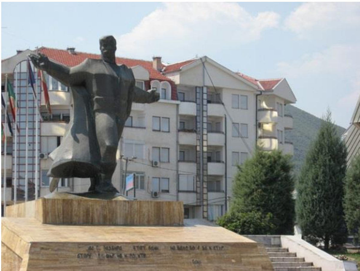
Споменик на Гоце Делчев во Струмица