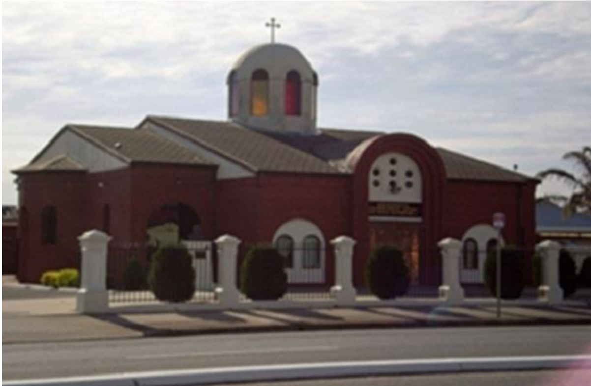
Црквата „Свети Наум Охридски“ во Аделајд

Името на списанието ја симболизира вековната борба на македонскиот народ и неговата незгасната и постојана верба во едно посветло и посреќно утре, за целосна национална, црковна и социјална слобода. Уште од првиот број, списанието „Искра“ привлекуваше со својата содржина и техничка опременост. Првиот број, како што е спомнато во воведот на англиски јазик, е посветен на 80-годишнината од Гоце Делчев, големиот македонски револуционер и симбол на етничките Македонци.