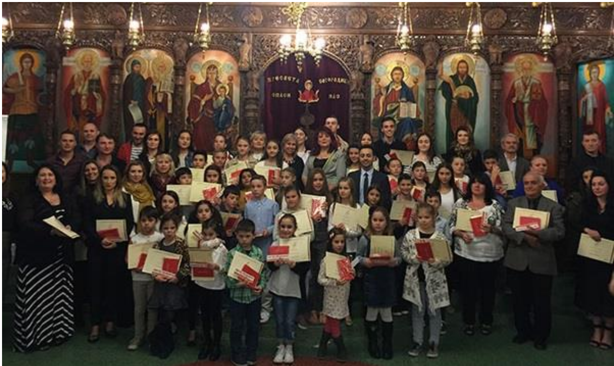
Македонски ученици во Сиднеј

Иницијативата за формирање на Македонскиот просветно-училишен одбор ја дале наставниците кои ја изведувале наставата по македонски јазик во етничкото училиште во сиднејската населба Њутаун, која почнала со работа во мај 1976 година. Истата година во јуни во населбата Јагуна, а подоцна и во други училишта во населбите Кенливејл, Анклиф и во Сент Џорџ, се формирале нови училишта. Идејата за формирање на Одбор била поддржана од црковната управа на МПЦО „Света Петка“ од Рокдеил и од другите македонски асоцијации во Сиднеј. Затоа Македонците во Рокдеил, предградие на Сиднеј се чувствувале како да се на Широк Сокак во Битола.