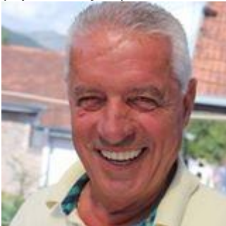
Пишува: СЛАВЕ КАТИН