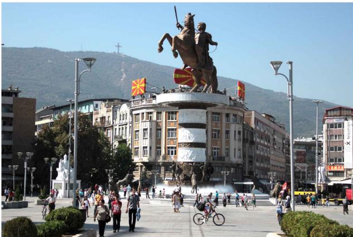
Скопје, Воинокот на коњ

Во 1929 година, во Понтијак, Мичиген, е формирана Првата македонска независна прогресивна група, чиј број подоцна се зголемил на шест во САД и Канада. Организирањето на соработката и координирањето на акциите меѓу прогресивните групи било доверено на Иницијативниот комитет, кој ја свикал Првата конференција, одржала во Толидо, Охајо, на 22 и 23 март 1930 година.