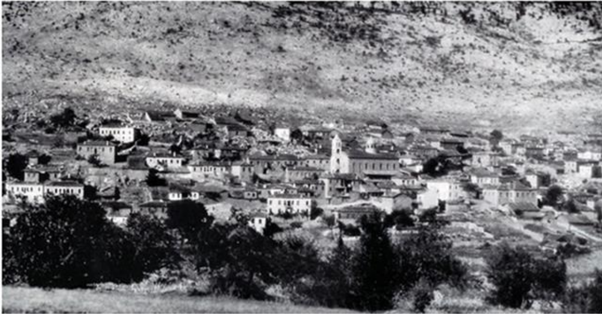
Д'мбени пред сто години