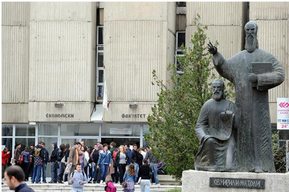
Универзитетот „Свети Кирил и Методиј“