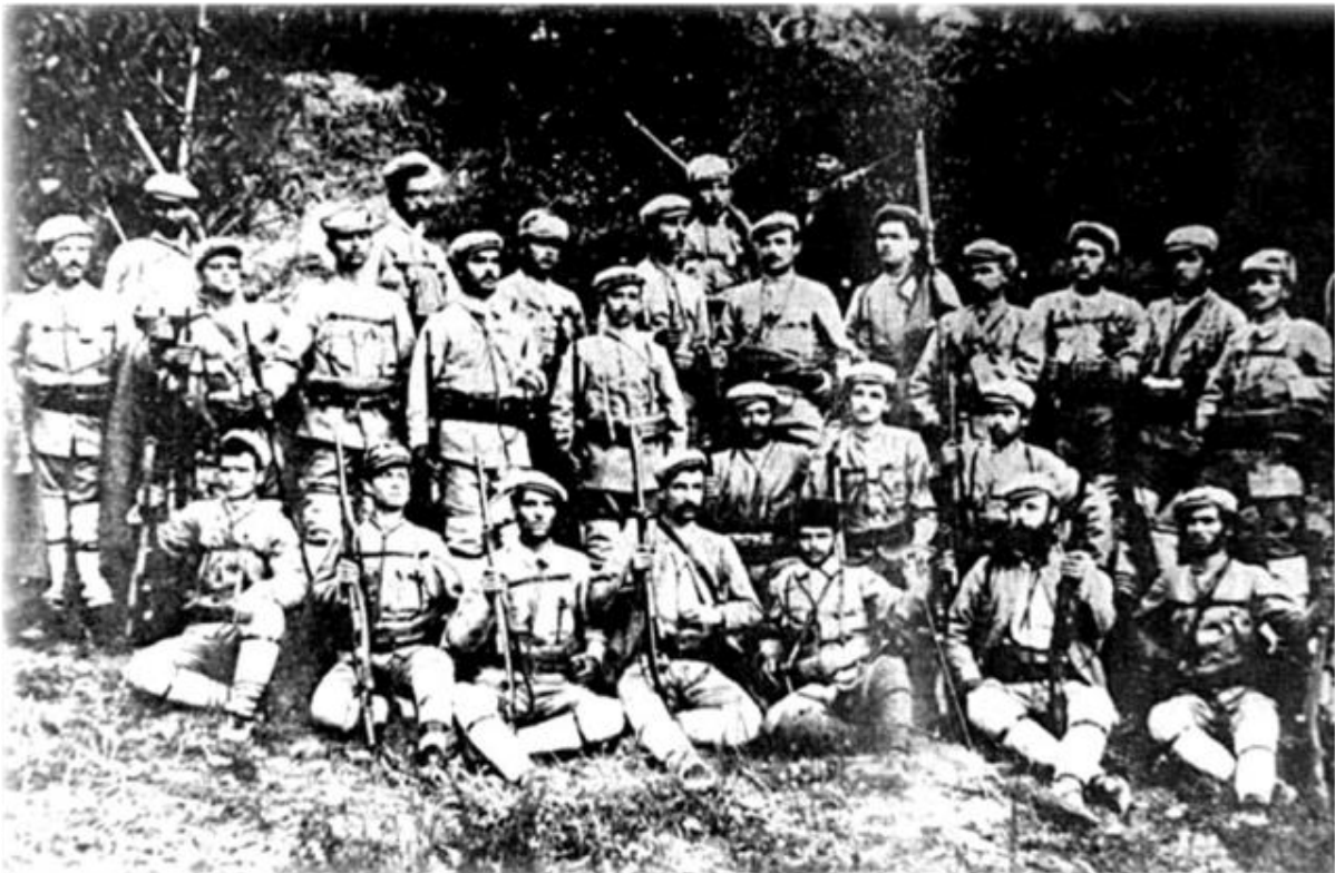
Илинденски борци во Смилево

Смилево е најубаво, највесело и најпривлечно на Илинден, на тој величествен ден на сенародниот македонски копнеж за борба и слобода, на најголемиот празник од сите празници во Македонија. Тоа со гордост го истакнува своето бурно минато исполнето со непокор и борба за опстанок. Во илинденскиот период таму се случиле бурни и драматични настани, а во текот на фашистичката окупација, Смилево било едно од жариштата на револуционерното движење и прва ослободена територија во Битолскиот регион.