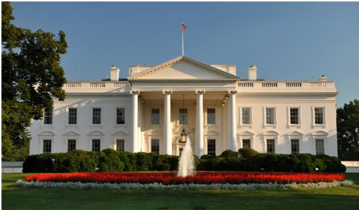
Белата куќа во Вашингтон

Присуството на ОМД во Вашингтон е од исклучително значење што може да се види по политиката на Америка спрема Македонија. Пред основањето на ОМД интересите на различни групи во Америка имаа значително влијание врз креирањето на американската политика спрема Македонија.