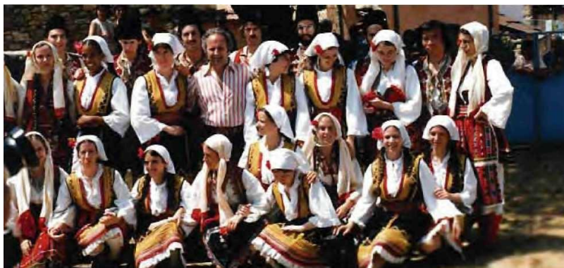
„МАКЕДОНСКИ ИСЕЛЕНИЧКИ МЕРИДИЈАНИ“ – САД

Ѓорѓи (Џорџ) Томов, кој беше меѓународен професор и бард на историјата на македонскиот танц и на ората, што се основа на нашата цивилизациска меморија, ги преплави светските фестивали и сцени со својата бесконечна љубов и стана легенда на македонската дијаспора и на македонската интернационална судбина.