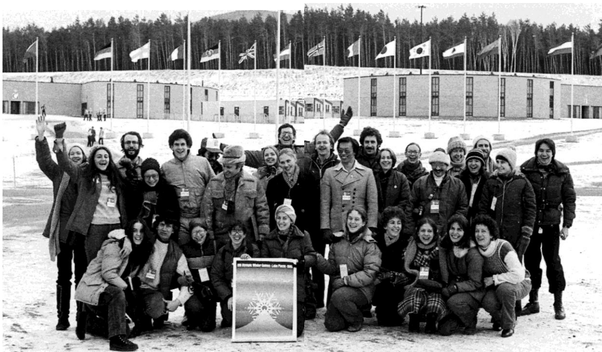
Ансамблот „Томов“ на Олимписките игри

Ансамблот “Томов” гостувал во Македонија, на сите фолклорни фестивали и пошироко на бившите југословенски простори, и тоа: 1974, 1975 и 1983 на Балканскиот фестивал во Охрид; 1976, 1977, 1979 на “Илинденските денови” во Битола; 1975 и 1976 на Смотрата на фолклорот во Загреб; 1975 на Дубровничките летни игри; 1981 и 1989 година на “Скопското лето” во Скопје и 1991 на Семинарот за фолклор во Струга. Неговата активност била активно следена и од македонските јавни медиуми.