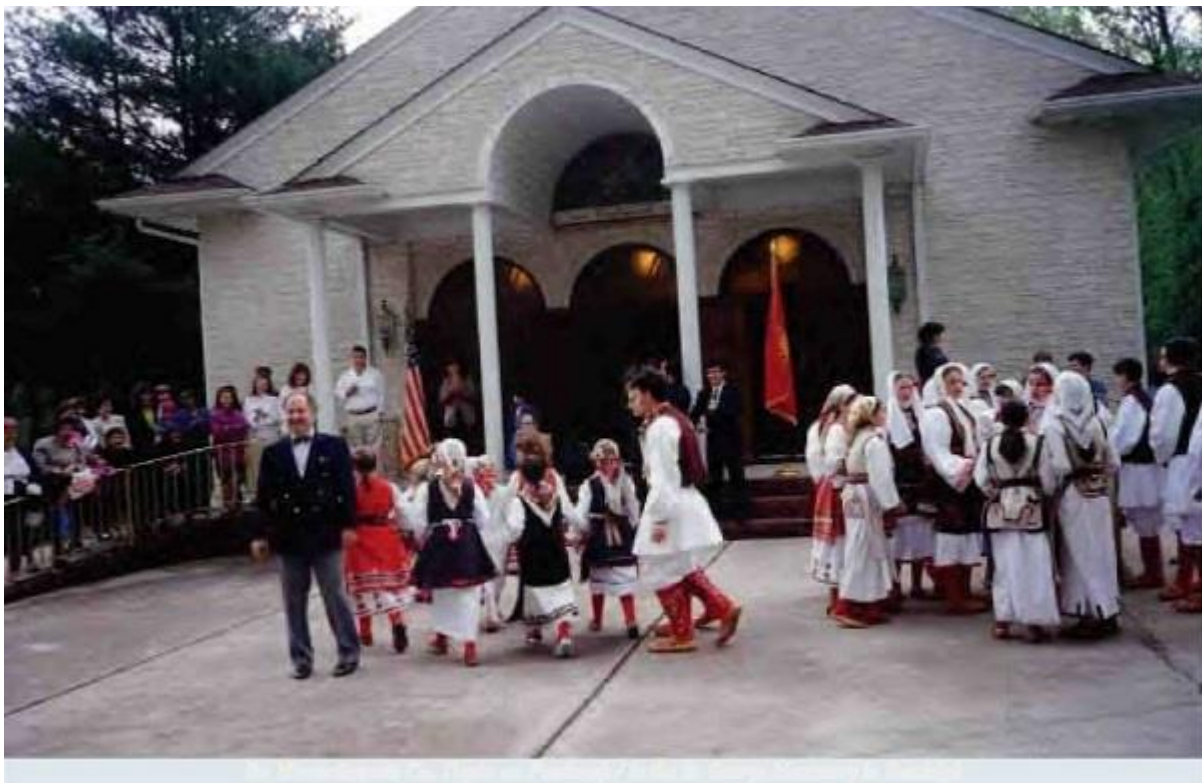
Ѓорѓи со македонски играорци пред манастирот „Св. Ѓорѓи“