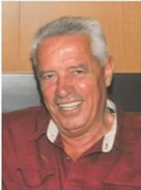
Пишува: СЛАВЕ КАТИН