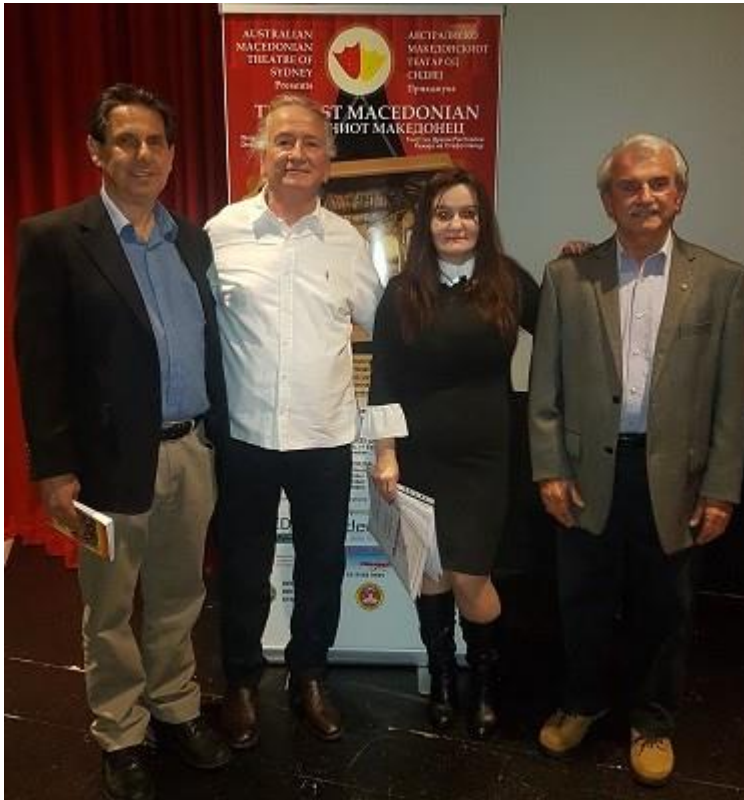
Од промоцијата на драмата „Последниот Македонец“