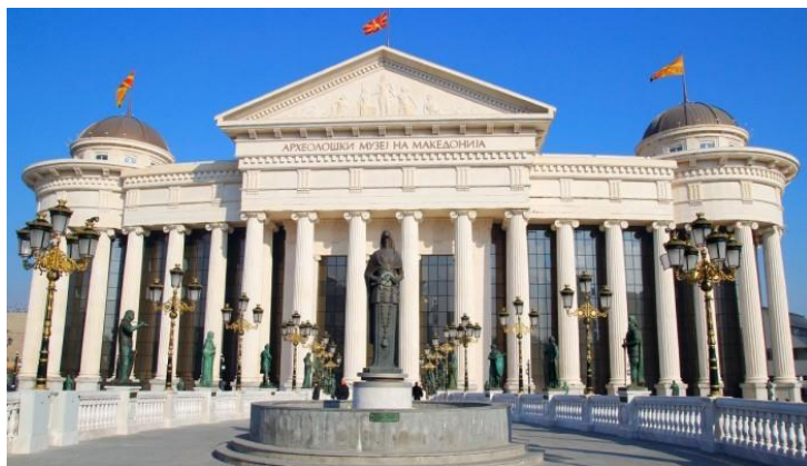
Археолошкиот музеј на Македонија во Скопје

Магнетизмот на Илинден во дијаспората најсилно се доживува во текот на илинденските иселенички празнувања. Во тој период најголемо внимание привлекуваат Илинденските пикници, како најмасовни манифестации на иселеништвото. На тие денови се одржуваат бројни црковни осветувања, полагање камен темелници на нови духовни храмови и одржување на национални, културни, црковни, спортски и други манифестации.