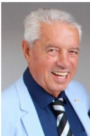
Пишува: СЛАВЕ КАТИН

Од 1991 година па до денес Македонија минува низ макотрпен период во својата демократска трансформација. Жилаво се бори со тешките економски, социјални, меѓуетнички, верски и други проблеми, кои ја потресуваат од корен. Иако со статус на членка на Обединетите нации и НАТО, асоцијативна членка на Европската унија, на Советот на Европа и на многу меѓународни организации, македонската млада држава, сè уште не може да се ослободи од старите апетити на некои соседи, но и од глобалните интереси на големите држави, кои се прекршуваат на Балканот.