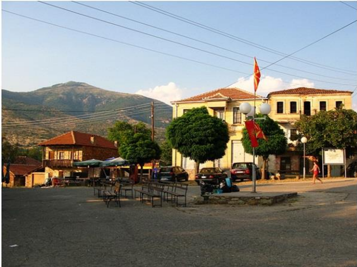
Дел од центарот на Љубојно

Според народните преданија, Љубојно своето име го добило од најубавиот збор љубов. Поточно, многу одамна се вљубиле момче и девојка, кои живееле во две соседни населби. Поради лошите меѓусоседски односи на жителите од населбите, младите не смееле да се земат. Меѓутоа, тие сепак одлучиле да се земат и заедно да побегнат. Се доселиле во близината на реката и тука останале среќно да си живеат. Подоцна, кај тоа место на вљубените, се доселиле други семејства и, поради тоа, населбата ја нарекле Љубојно.