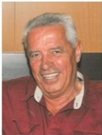
Пишува: СЛАВЕ КАТИН www.slavekatin.com

Љубојно е едно од најкарактеристичните места во Преспа и пошироко. Долго време претставуваше општински, образовен, културен и здравствен центар за Долна Преспа и пошироко. Тоа е едно од најубавите села кое пленува со своите архитектонски градби, со стилот на старите куќи, сокаците и дворовите, како и со иновациите во начинот на живеење што бројните печалбари ги пренеле од светот во својот роден крај.