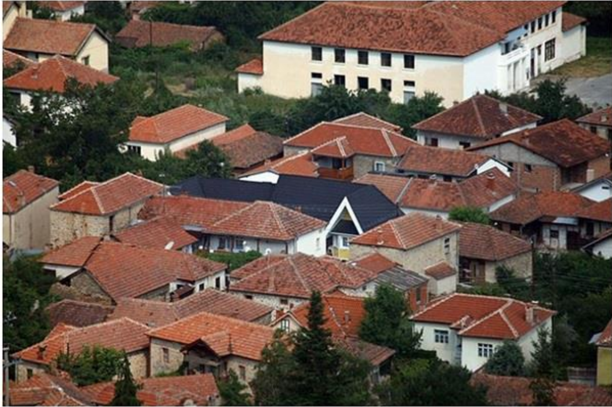
Дел од Љубојно

Печалбарството како „стар занает“ од Македонија, а со тоа и од Љубојно помасовно започнало уште на почетокот во XIX век. Одењето на гурбет во прекуморските земји, се интензивирало пред и по Илинденското востание, меѓу двете светски војни и особено по Втората светска војна. Затоа, со право се вели дека љубанци биле едни од првите од Македонија кои свиле нови гнезда по светот и се едни од најбројните Преспанци во дијаспората.