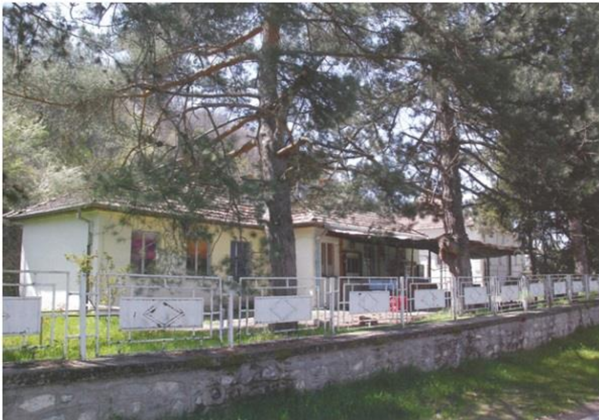
Штабот на војската во Љубојно

Интересно е да се спомене дека во 1950 година во Љубојно се формирани два фудбалски клуба „Пелистер“ и „Слога“, кои пет години се натпреваруваа во Преспанската фудбалска лига. Шеесетите години од минатиот век се карактеристични за спортот во Љубојно со развојот на спортската дисциплина одбојка. Така, Љубојно била единствената селска населба во Македонија која имала одбојкарски клуб, кој се натпреварувал во Првата македонска одбојкарска лига. Одбојкарскиот клуб „Љубојно“, се натпреварувал со елитните екипи „Вардар“ од Скопје, потоа екипите од Титов Велес, Струмица, Тетово, Битола и други градови во Република Македонија.