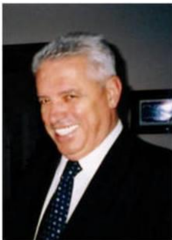
Пишува: СЛАВЕ КАТИН

На прославата на четириесет и шесте „Љубански илинденски иселенички средби“, се потврди дека родното место, со невидена сила ги привлекува иселените повторно да се вратат на дедовските корени. На средбата во прекрасната атмосфера присутните ги доживееја деновите и моментот како во поранешните времиња. На иселеничките средбите иселениците беа дел од многубројните случувања кои остануваат за паметење во родното печалбарско Љубојно и Македонија.