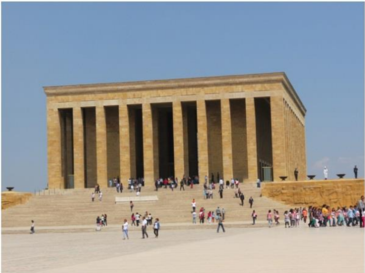
Мавзолејот на Кемал Ататурк

турскиот народ и на целото човештво со општоцивилизациски вредности.