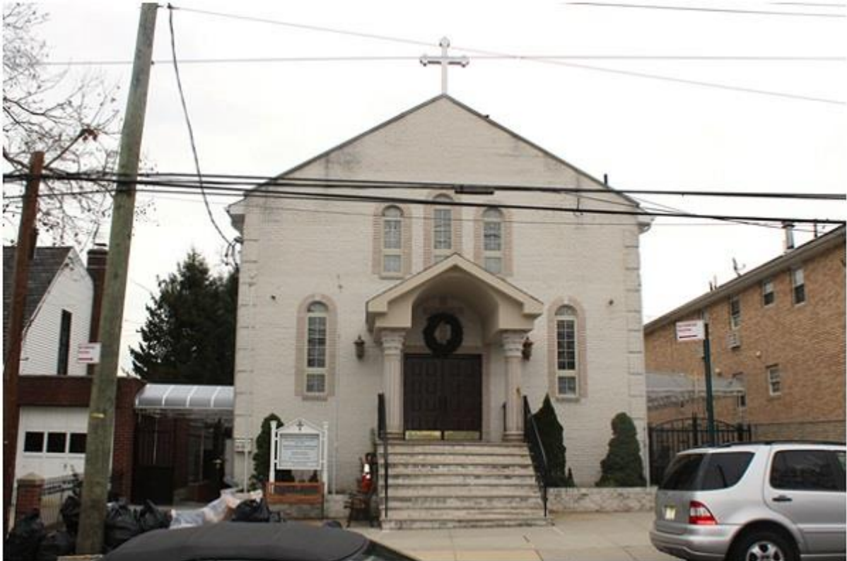
„Св. Климент Охридски“ во Њујорк

Често се вели дека патиштата на северноамериканскиот континент, главно, водат, се вкрстуваат или заминуваат од светската метропола - Њујорк. Овој мегалополис по многу нешта е карактеристичен, контроверзен, убав и значаен, ако не и најзначајниот град на светот, чија архитектура, култура, минато и сегашност се еден импозантен и многу впечатлив мозаик, кои му даваат посебен и уникатен белег. Затоа, не случајно се рекло дека да се види Њујорк значи да се почувствува големината, постигнувањата и развојот на човештвото, со вистините кои се видени на филмското платно, преку малиот екран, во фантазиите, мечтите на јаве. Меѓутоа, се чини дека од сè највпечатлив е Њујорк од авион, кога сите карактеристичните згради, авениите и друмовите со своите нишани од птичја перспектива се имаа како на дланка и ја збогатуваат американската разгледница и силните впечатоци на туристите.