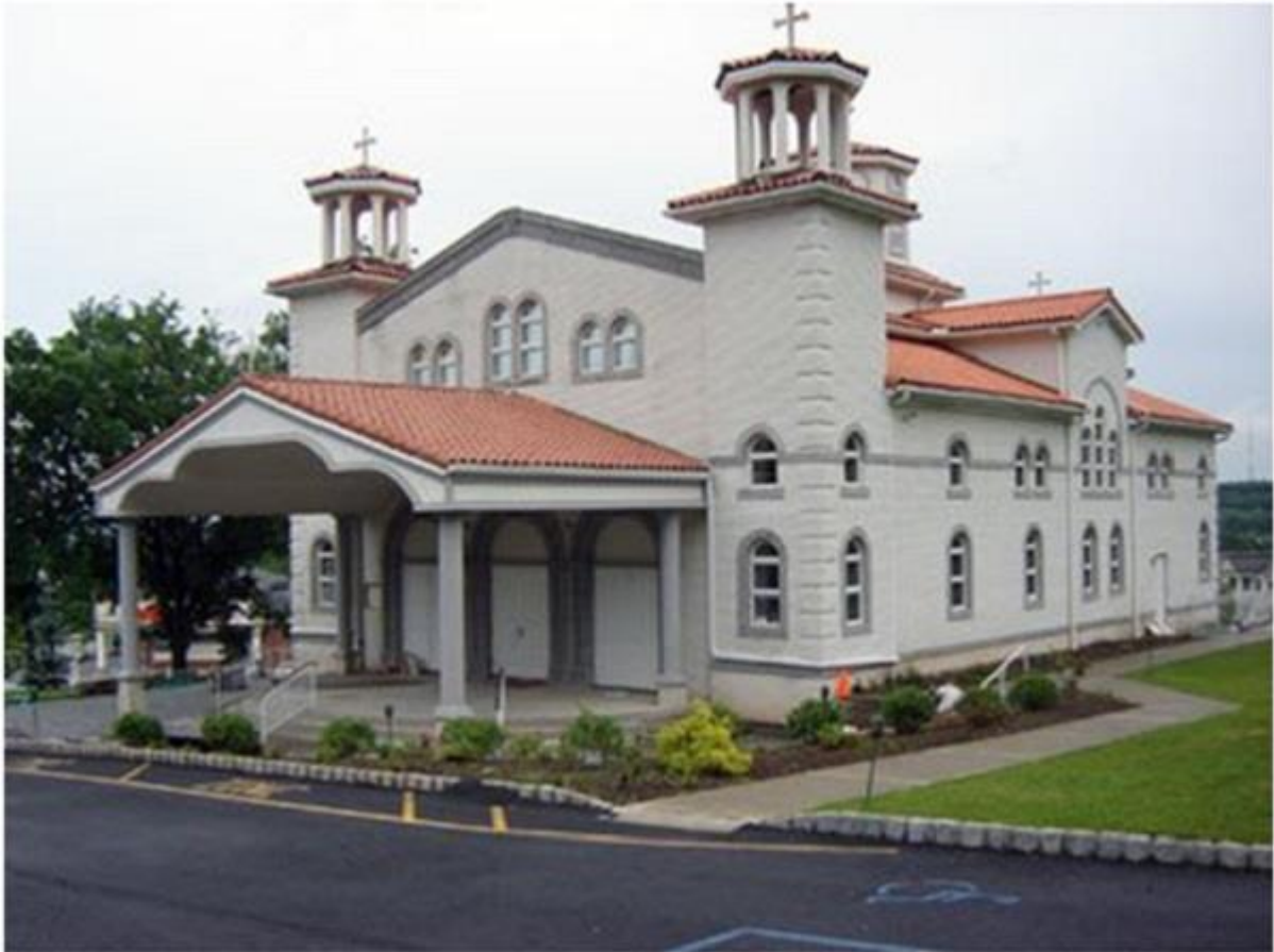
МПЦ „Свети Кирил и Методиј“ во Пасаик

на Њујорк се движат повеќе од 5,5 милиони патнички возила 1,5 милиони автобуси и повеќе од еден милион жолти такси-возила. Освен тоа, во Њујорк од разни правци и градови дневно влегуваат околу 600 000 автомобили. За да се сфати колку е жив сообраќајот, треба да се додаде и тоа дека и под-земните железници дневно превезуваат околу 10 милиони патници. Бројки што навистина пленуваат и збунуваат.