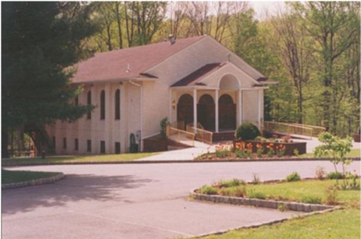
Манастирот „Свети Ѓорѓи“ во Њу Џерси