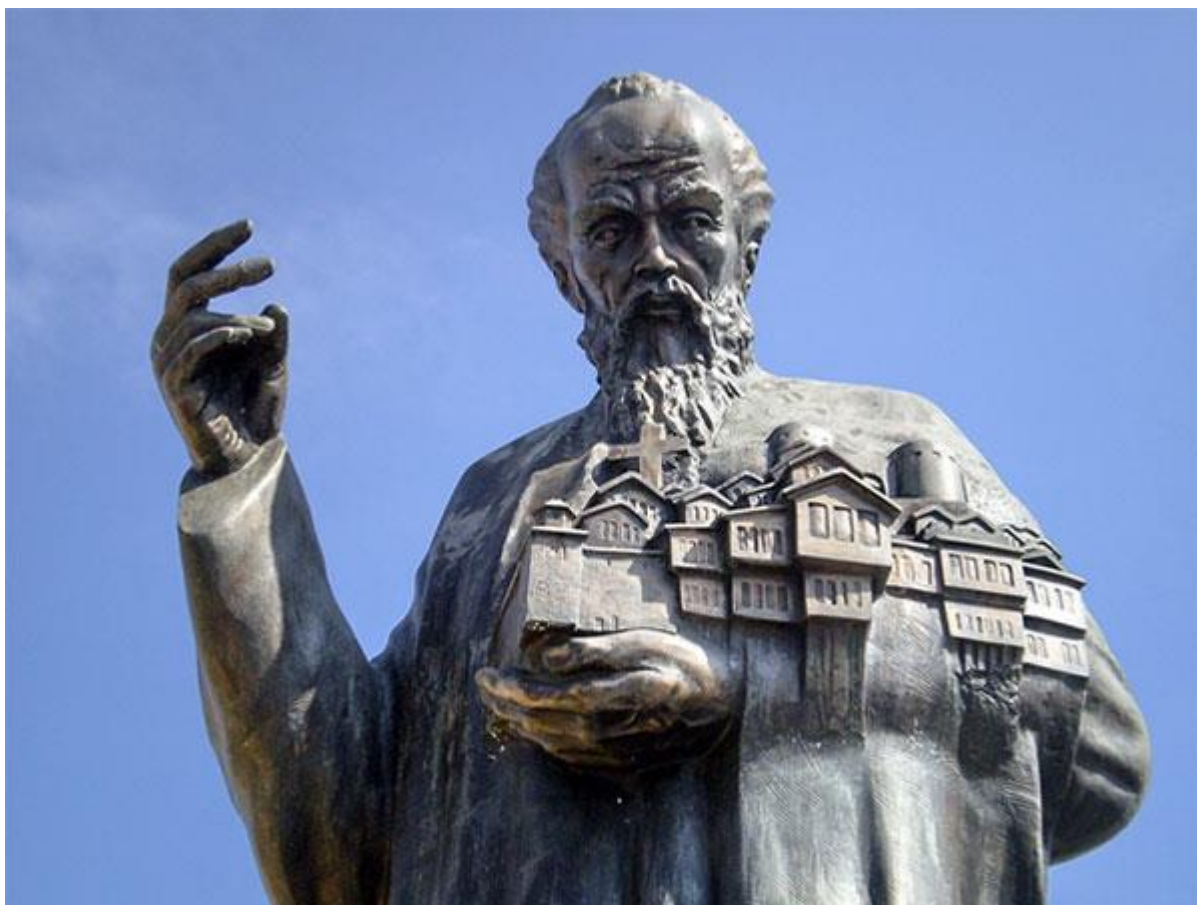
Св. Наум Охридски

Инаку, идејата за изградба на Македонската православна црква „Свети Климент Охридско“ во Лореин била реализирана на 9 април 1978 од членовите на црквата, кои претежно дошле од преспанскиот, битолскиот и други краишта на поделена Македонија. Прва богослужба на македонски јазик била отслужена во Украинската црква. Тогаш е купено место каде била изградена сала со привремено адаптиран олтар, каде денес до салата е црквата „Свети Климент Охридски“.