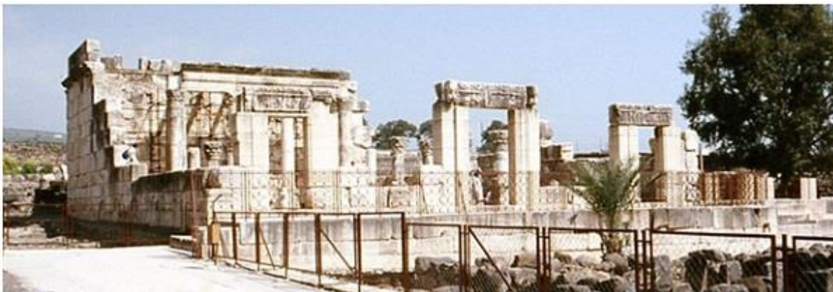
Дел од синагогата во Капернаум

Еден дел од Капернаум припаѓа на Католичката црква, која уште на влезот од древниот град поставила споменик на Свети Петар, еден од тројцата омилени Христови ученици. Инаку, Свети Петар е познат како Симон Петар, Шимон и Кифа. Тој потекнува од рибарското село Витсаида што се наоѓа на брегот на Галилејското Езеро, а со брат му Андреј биле рибари. Името Петар или Кифа значи камен, карпа и тоа му го дал Исус Христос со зборовите: “Ти си Петар (Кифа) и на тој камен ќе изградам црквата Своја”. Запишано е дека Петар ги предводел апостолите и прв проповедал меѓу паганите. Се одрекол од Христа три пати пред распнувањето, а по воскреснувањето, Петар три пати му ја посветил љубовта на Исус.