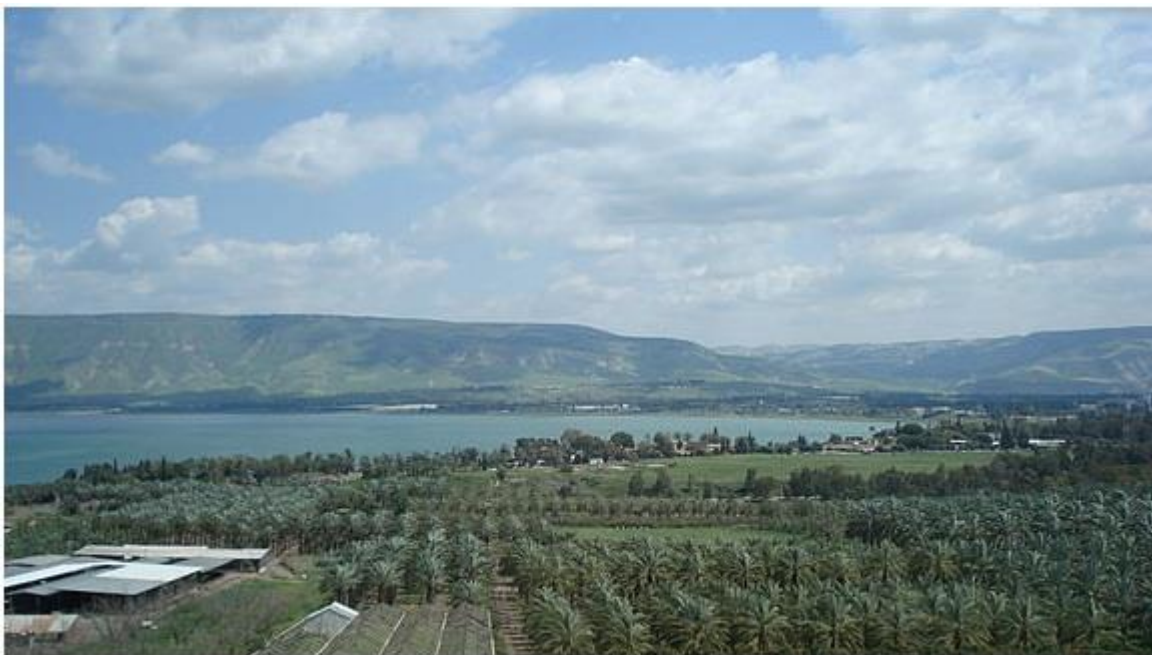
Галилејското Езеро и плодното поле

Тиверијада не е само град на дијамантите, туку тој е познат и како град на туризмот. Распространет на живописните предели на Галилејското Езеро и со зелени површини, овој град привлекува голем број посетители. Хотелските објекти се преполни во текот на целата туристичка сезона, која овде започнува од февруари. Тиверијада своето име го добила од римскиот император Тивериј, што значи град постар од 2.000 години. Со мноштво споменици, тврдини и други религиозни историски згради и локации, Тиверијада е едно од четирите свети места за Евреите, заедно со Ерусалим, Хеброн и Сафат. Меѓу другото, овој град е место на познатите просветители и рабини кои имаат значајно место во историјата на еврејскиот народ.