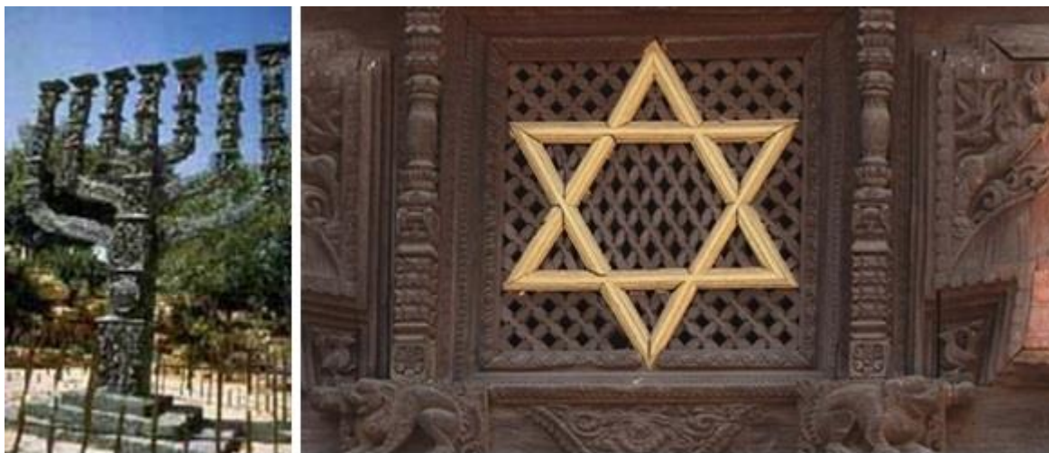
Симболот на Јудеизмот Давидовата ѕвезда

Исто така, во Капернаум ја видовме древната синагога, една од најстарите и најзначајните синагоги во Галилеја. Но таа не е онаа синагога во која Исус Христос проповедал, туку таа е изградена во 9. век. Таму во православниот дел од Капернаум ја посетивме црквата “Архангел Михаил”, која ете, и таа е под управа на Грчката православна црква. За жал, домаќинот, грчкиот свештеник се однесуваше како Господ да е “Грк или од грчко потекло”, што остава дамка кај христијаните, особено на оние од Македонија кои доаѓаат и со голема љубов и почит кон религијата ги посетуваат светите места во Израел.