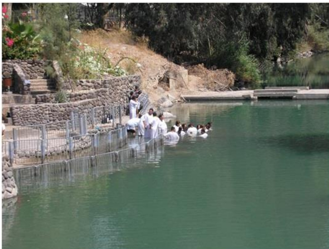
Местото каде бевме крстени во Реката Јордан

На север од градот Тиверијада се простира висорамнината Голан. Таму таа се наметнува со сета своја убавина, големина, богатство и значај за опстанокот на државата Израел. Таму е тремеѓето меѓу Израел, Сирија и Јордан. Долу во подножјето, пак, се топлите извори во Хамад Гадер, на реката Јермук, каде некогаш во времето на својата болест, доаѓал и проповедникот Јов. Тука се и остатоците на некогашната огромна римска бања и денешните резервати за одгледување крокодили. Тука е местото Магдал кое претежно е земјоделско подрачје и се наоѓа во јужниот дел на долината Гиносар. Тоа е древен град што бил познат како родно место на Марија од Магдала (Света Марија Магдалена), која подоцна била и една од најверните следбеници на Исус Христос. Како спомен на библиските преданија и библиското време овде има ископини од тој период, кој се доста важни за христијанството. Сепак, Гиносар како и Магдала, така и целиот регион од Голан, за Израел претставува едно од најзначајните земјоделски региони и простор во чии предели се чуваат и спомените од библиското време.