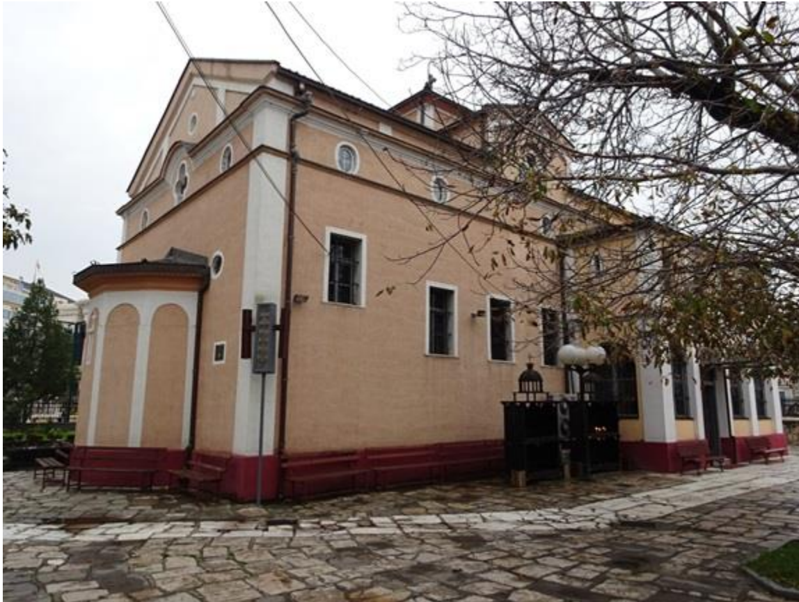
Црквата „Свети Димитрија“ во Скопје

Во негово време од темел била возобновена Црквата, со сите нејзини витални органи: епархиите, епископатот, свештенството, црковните општини во татковината и во дијаспората, црквите и манастирите, образованието и просветата. Во 1967 година била отворена Богословијата, а во 1977 година Богословскиот факултет во Скопје.