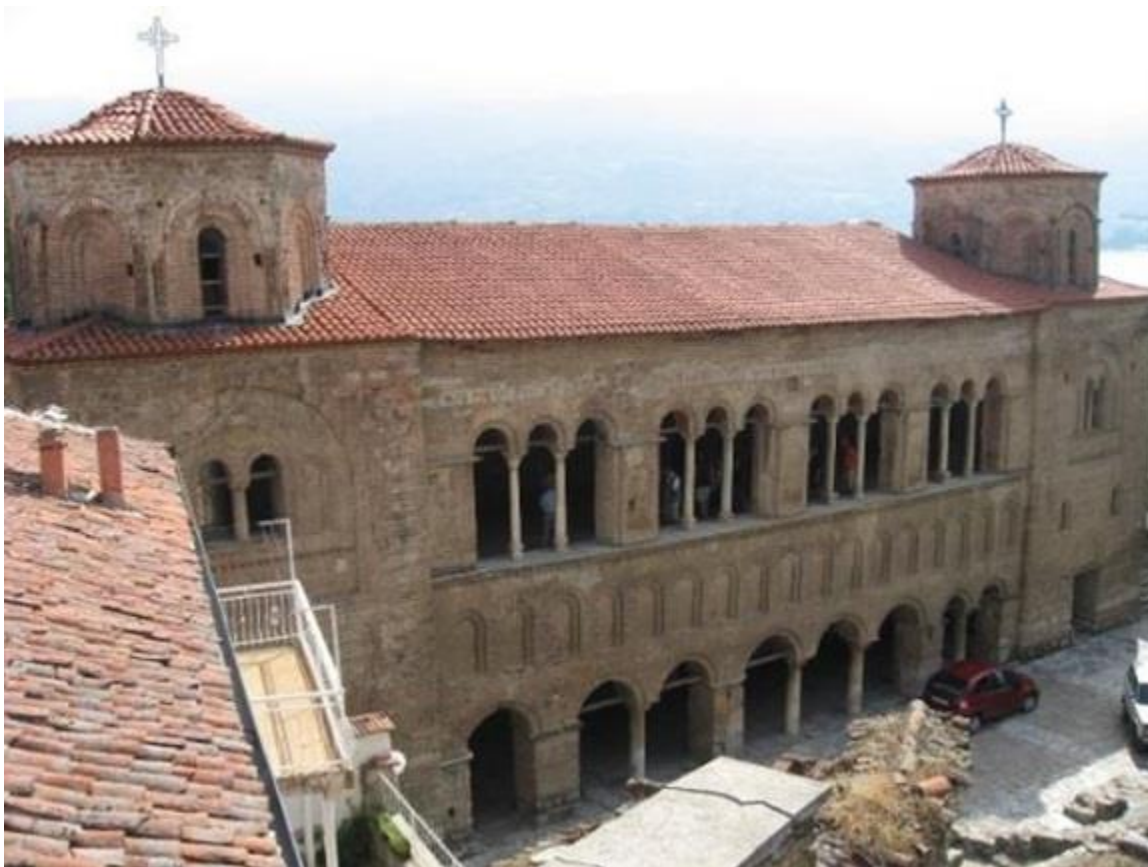
„Света Софија“ во Охрид