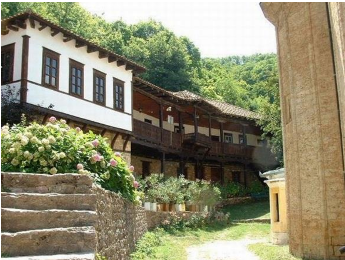
„Света Богородица Пречиста“ во Кичевско