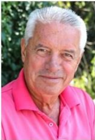
Пишува: СЛАВЕ КАТИН