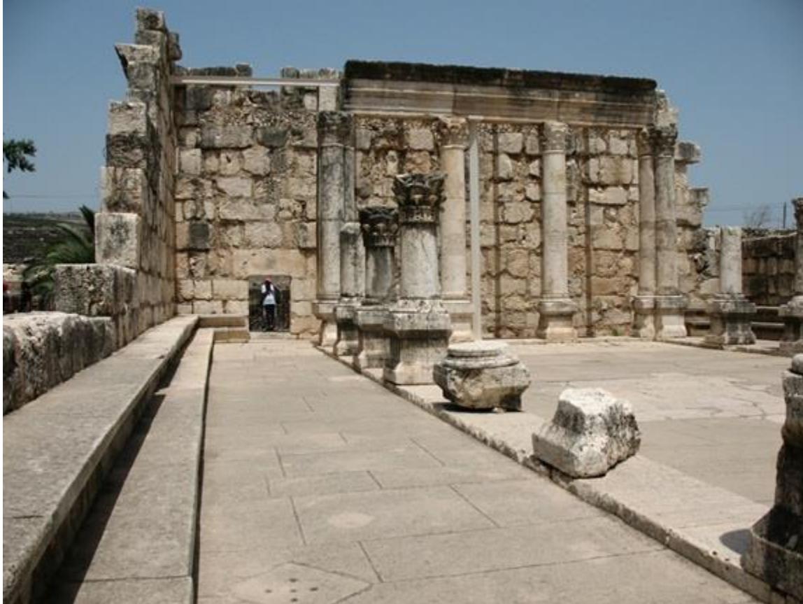
Капернаум во Израел

Христијанството во Македонија започнало да се проповеда уште во апостолско време. По прифаќањето на христијанството, апостол Павле станал првиот проповедник на новото месијанско учење при своите мисионерски патувања. Апостол Павле, за време на својата мисионерска дејност, спровел повеќе мисионерски и благовеснички патувања, во текот на коишто тој го проповедал христијанството меѓу еврејското и паганското население. Апостол Павле во Македонија престојувал четири пати.