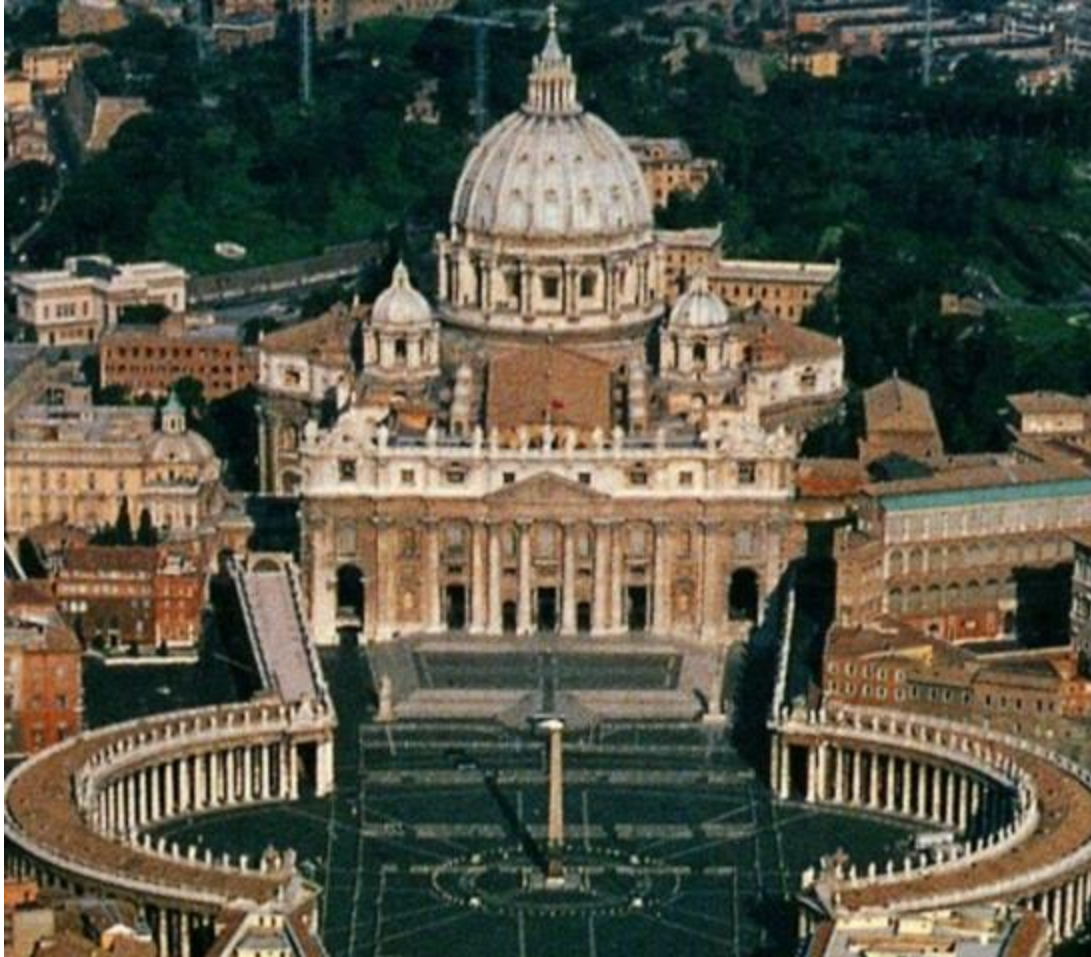
Ватикан местото на апостол Павле

Дејноста на апостол Павле била распространета од Ерусалим до Рим. Тој пораснал во Ерусалим и се занимавал со изработка на шатори. Рабинот Гамалиел го учел на фарисејството, го интересирал Талмудот, а станал и еден од главните членови на антихристијанскиот еврејски совет, во чии активности спаѓа прогонувањето на христијаните и убиството на свети Стефан.