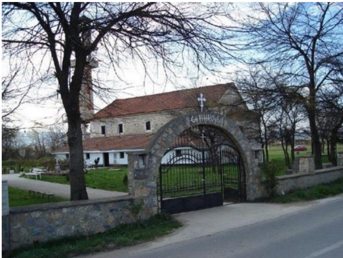
Црквата „Свети Никола“ во Царев Двор