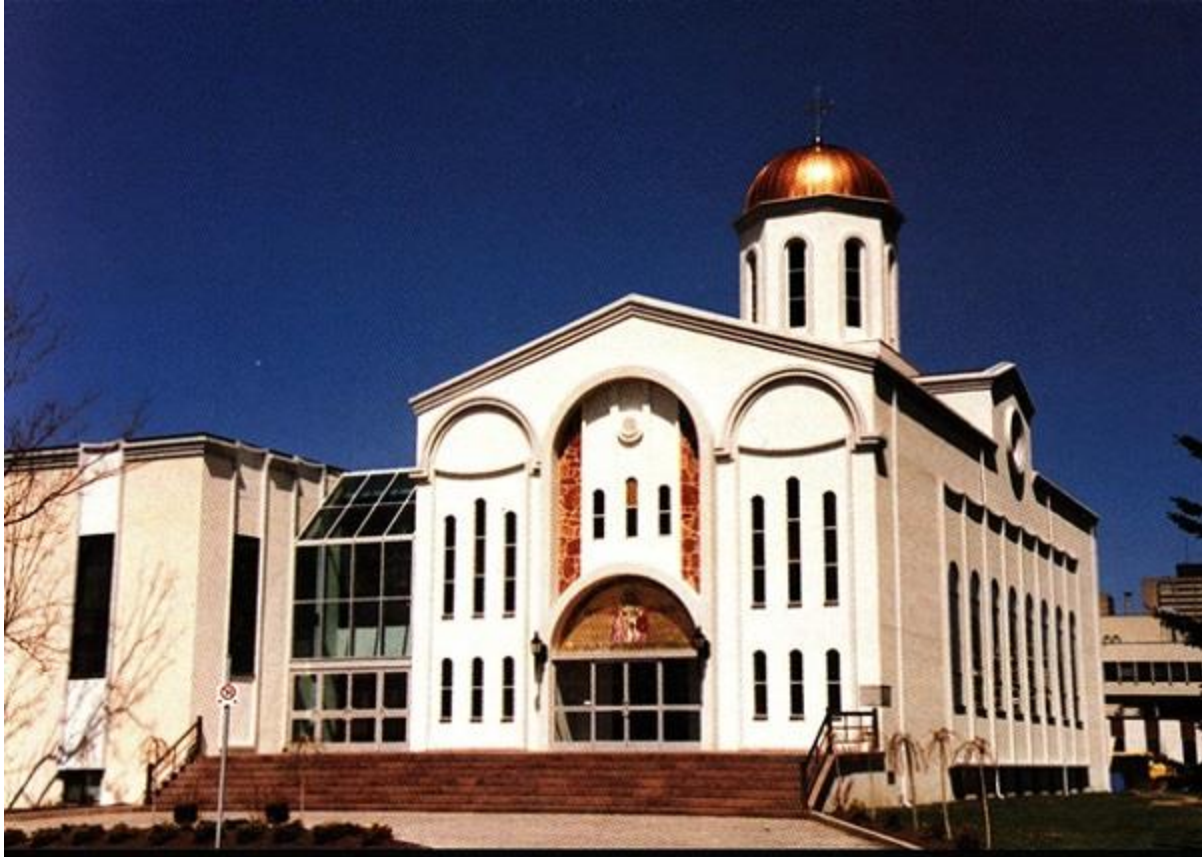
„Свети Климент Охридски“ во Торонто