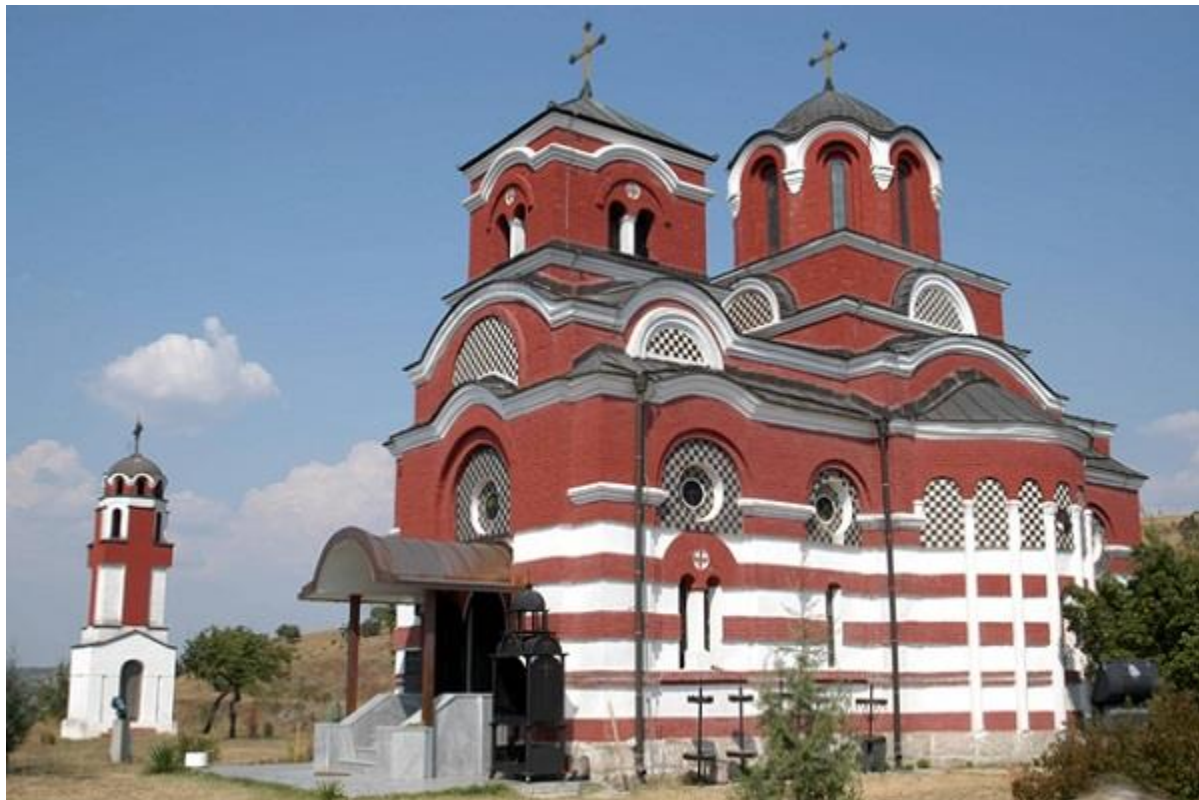
Црквата „Свети Ѓорѓија“ во Дељадровци